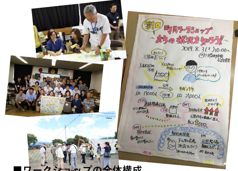
■ワークショップの全体構成