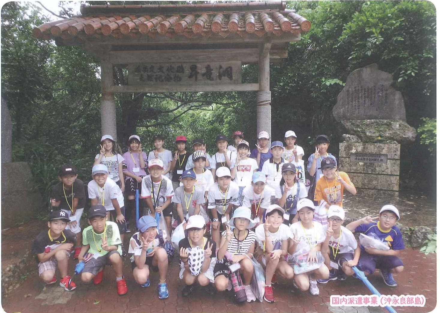
国内派遣事業（沖永良部島）

生涯学習情報誌 2020年4月 April 2020 Lifelong Learning Newsletter