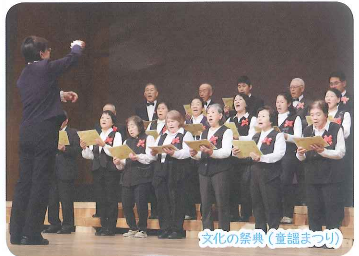
文化の祭典（童謡まつり）