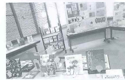
絵本と児童書の展示会