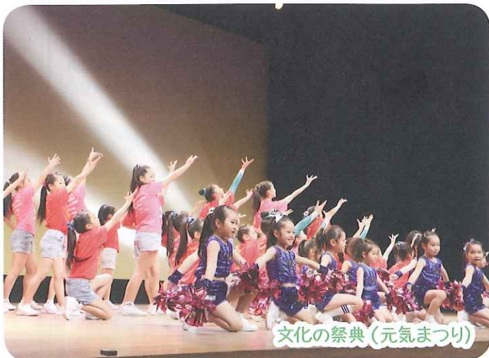
文化の祭典（元気まつり）