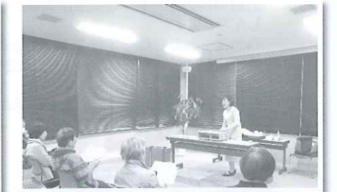
手まわしオルゴール演奏会

★お問合せ・連絡先…三股町立図書館 TEL 51-3200 HP アドレス http://mimata-lib.jp/