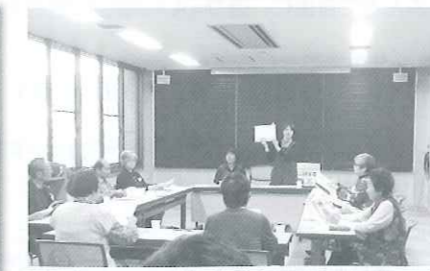
音読にチャレンジ