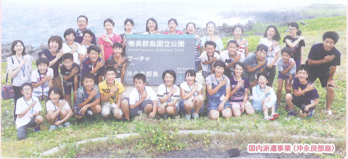
国内派遣事業 (沖永良部島)