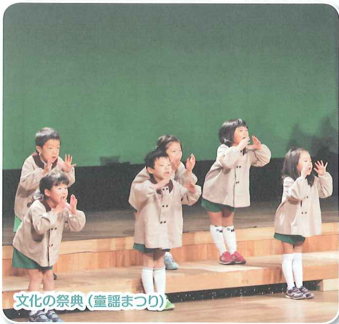
文化の祭典 (童謡まつり)