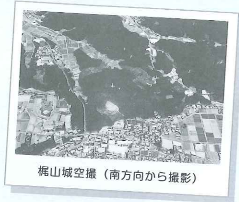
梶山城空撮（南方向から撮影）

梶山城は中世の山城で、梶山小学校の北側に位置しています。別名を小鷹城、あるいは雄鷹城といい、江戸時代には絵図が作成され、その存在を裏付ける史料が確認されています。一部崩れていますが、現地の保存状態は良好で、その文化的価値は町内外で高く評価されています。国指定史跡クラスとの評価を受けている梶山城跡をどのように整備し、公開していくかが今後の大きな課題となっています。