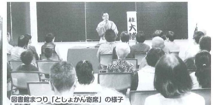
図書館まつり「としょかん寄席」の様子