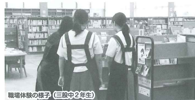
職場体験の様子（三股中2年生）