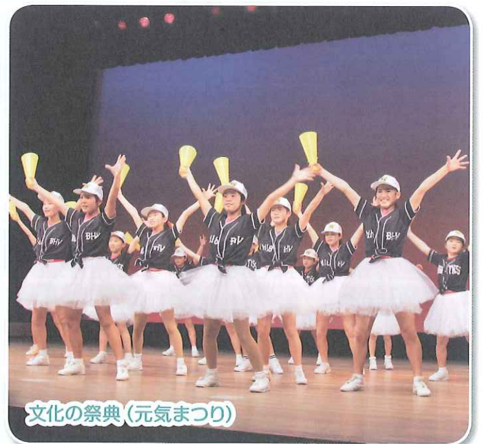
文化の祭典 (元気まつり)