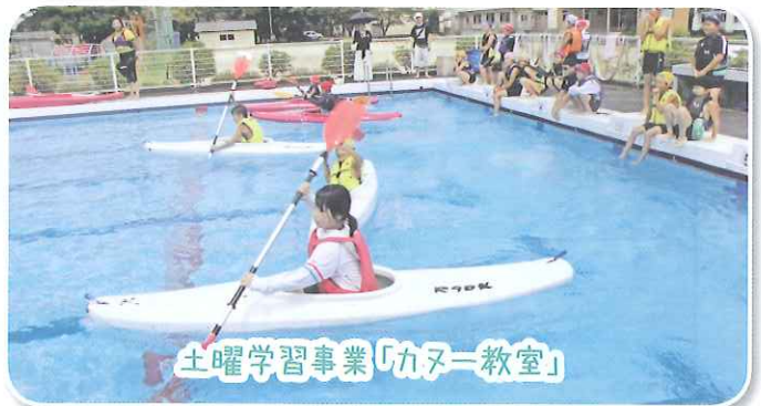
土曜学習事業「カヌー教室」