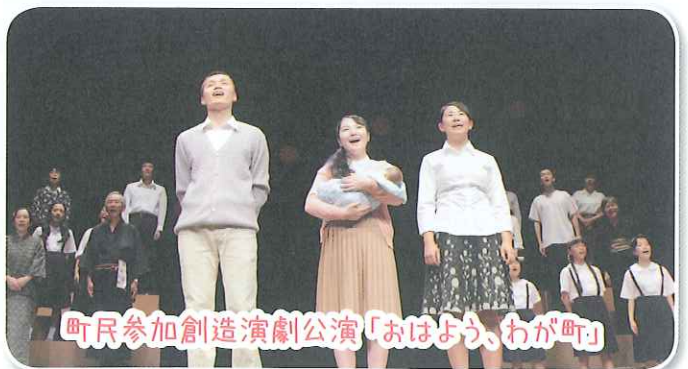
町民参加創造演劇公演「おはよう、わが町」