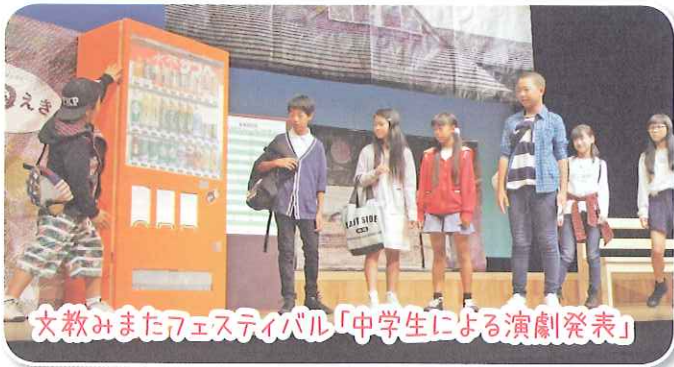
文教みまたフェスティバル「中学生による演劇発表」