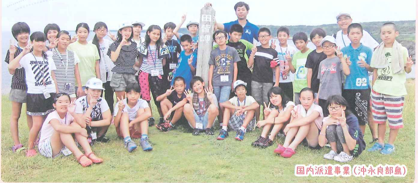
国内派遣事業(沖永良部島)