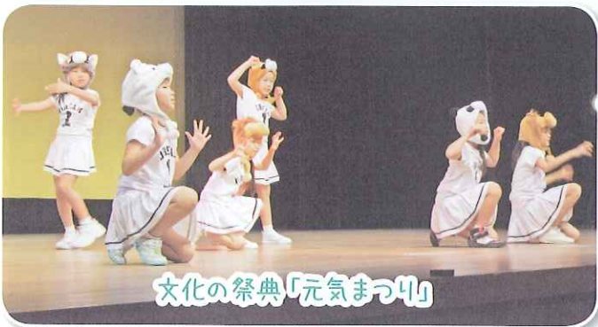
文化の祭典「元気まつり」