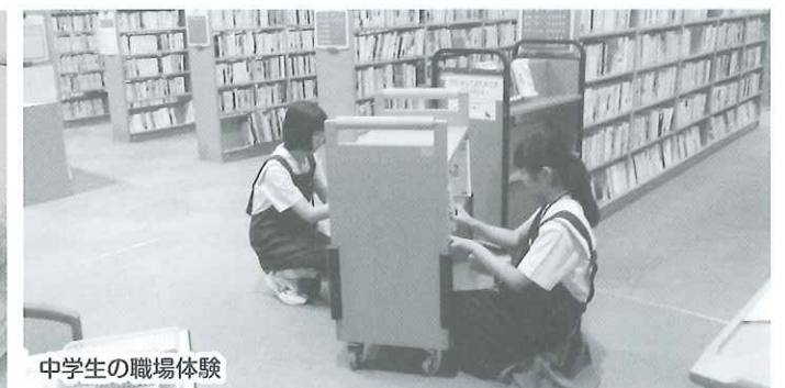
中学生の職場体験