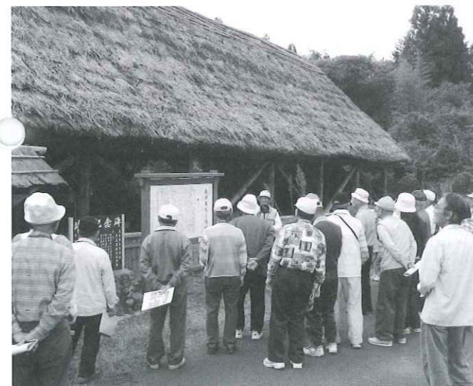
島津寒天工場跡にて

☆コース：①樺山納骨堂②釋憲隆の墓③田島かくれ念仏洞(山之口町)④蓼池かくれ念仏洞 ⑤島津寒天工場跡(山之口町)⑥田辺かくれ念仏洞(高城町)⑦石山観音寺(高城町)