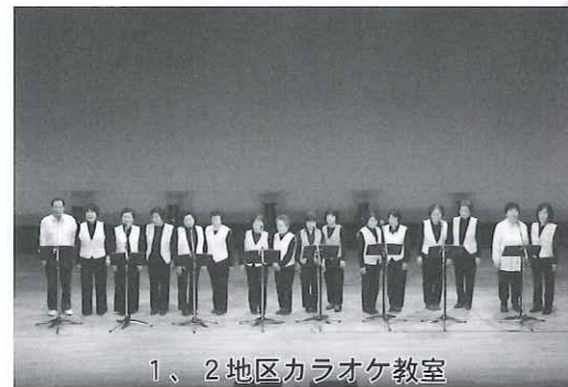
1、2地区カラオケ教室