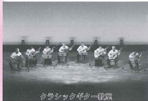
クラシックギター教室