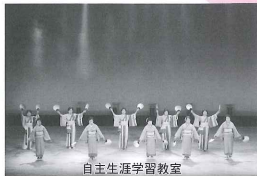
自主生涯学習教室