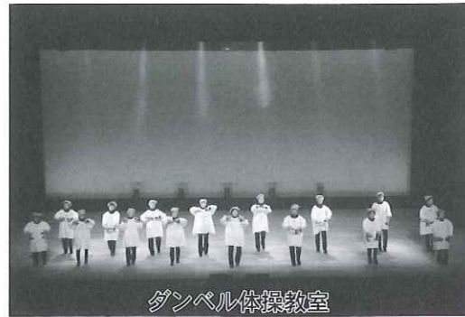
ダンベル体操教室

昨年度も、多くの方が、知識の向上や健康づくりを目的として、いろいろな教室に参加されました。みなさん、一緒に楽しんでみませんか。