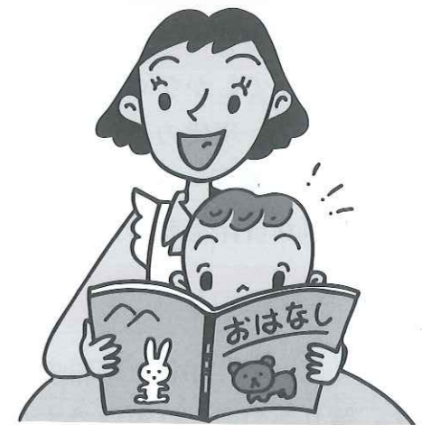
図 書……………約109,000冊 AV資料(ビデオ・CD・DVD) 約5,500本 雑誌……………約81タイトル