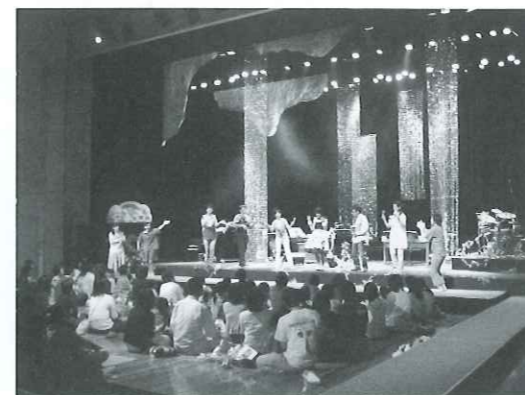
おはなしと音楽のコンサート