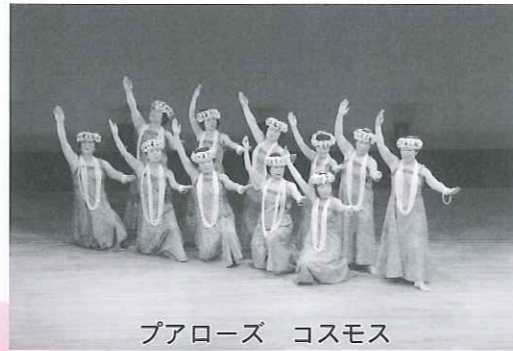
プアローズ コスモス