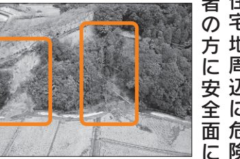
上米公園の法面崩壊