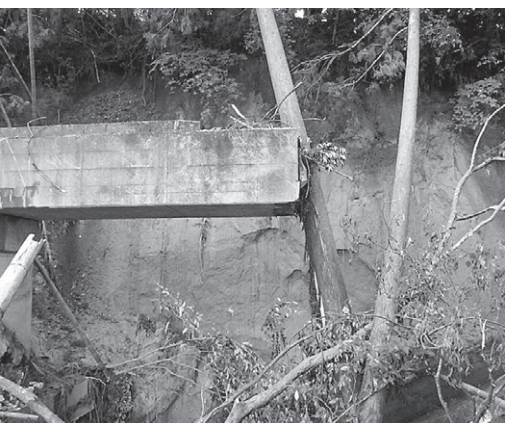
福留地区の榊山水路橋崩壊

台風14号により福留地区の榊山水路が約15メートル崩壊しています。現在、県、関係機関と災害復旧事業として申請するための測量・工法等の検討をしています。工法が決まり事業費の積算ができた段階で、国の災害査定を受け、事業決定後に工事発注する予定です。できる限り来年の田植えまでに、通水に向けて取り組んでいきたいです。