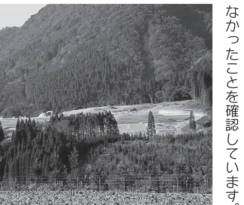
大野地区のメガソーラー

大野地区の住民に特化した避難理由はわかりませんが、台風14号が猛烈な規模の台風であったことにより各種警報や「土砂災害警戒情報」などが発令され、同日午前7時30分には警戒レベル4「高齢者等避難」、昼12時30分には警戒レベル5「緊急安全確保」が発令されたことで最大の危機感をもって避難されたものと考えられ、他の住民も同じ心境で避難されたものと捉えています。