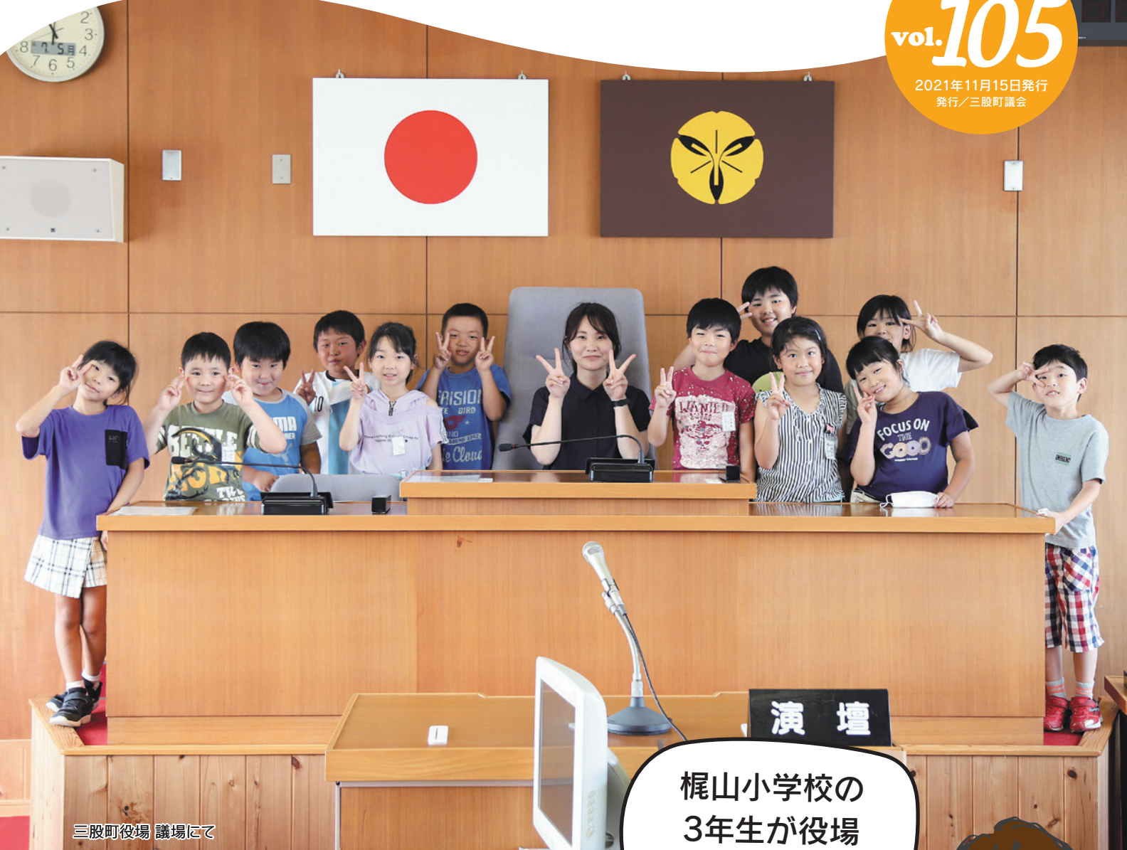
三股町役場 議場にて