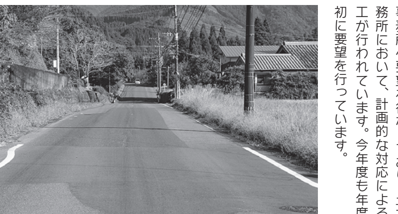
県道33号線の消えてしまった白線

Q 三股町を走る県道33号線の白線が消えていますか、その対応はいかがでしょうか? A 都市整備課長 県道33号線(都城北郷線)は、道路上の区画線が消えている、または視認しづらい場所があります。区画線の引き直しなどについては、適宜、都城土木事務所へ要望を行なっており、土木事務所において、計画的な対応による施工が行われています。今年度も年度当初に要望を行っています。