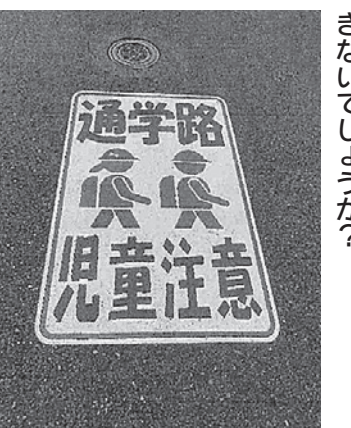
通学路児童注意の路面表示

Q 交通安全対策として、信号機設置要望についての今後の対応(特に樫田〜梶山に通じる広域農道の交差点)と、設置されるまでの対策として、路面に「児童注意」等の標示はできないでしょうか? A 総務課長 信号機や横断歩道の設置、標識の新設等に関する住民要望については、警察署へ直接陳情に伺っていますが、信号機の設置要望については成果に至っていないのが現状であり、引き続き要望活動を実施したいと思います。