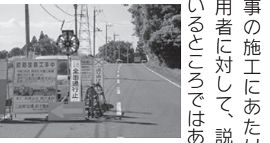
全面通行止め箇所

Q 島津紅茶園切寄線は工事期間中、全面通行止めではなく片側通行にできないでしょうか? A 都市整備課長 全面通行止めによる施工は、地域の道路利用にご不便をおかけすることとなりますので、工事の施工にあたり、沿道の耕作者や利用者に対して、説明や調整を行っているところではありません。より一層のご理解とご協力をお願いいたします。