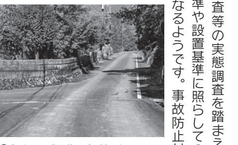
「止まれ」標識要望箇所

Q 轟木・表川内線に「止まれ」の標識を設置できないでしょうか? A 総務課長 交通量調査等の実態調査を踏まえ、規制実施基準や設置基準に照らしての設置判断となるようです。事故防止対策が必要な場合は、標識以外の対策を含め検討していきたいと考えます。