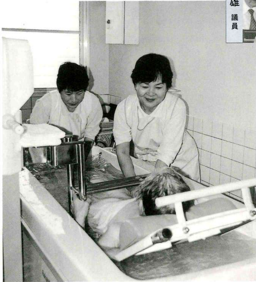
▲高齢化社会が進むにつれ介護が重要な問題となってくる