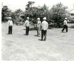
▲現地調査を行う総務文教委員