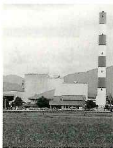
▲来年3月まで閉鎖される都城処理場

大気汚染防止法の改正により、今まで使用していた可燃ごみ処理施設の工事を行うことになりました。工事期間は、平成12年6月から平成13年3月までとなっています。その間、可燃ごみ処理施設が閉鎖されるため、三股町において年間約1,892t排出される可燃ごみの処理を、1t当たり4万円の単価で民間施設に委託することになりました。