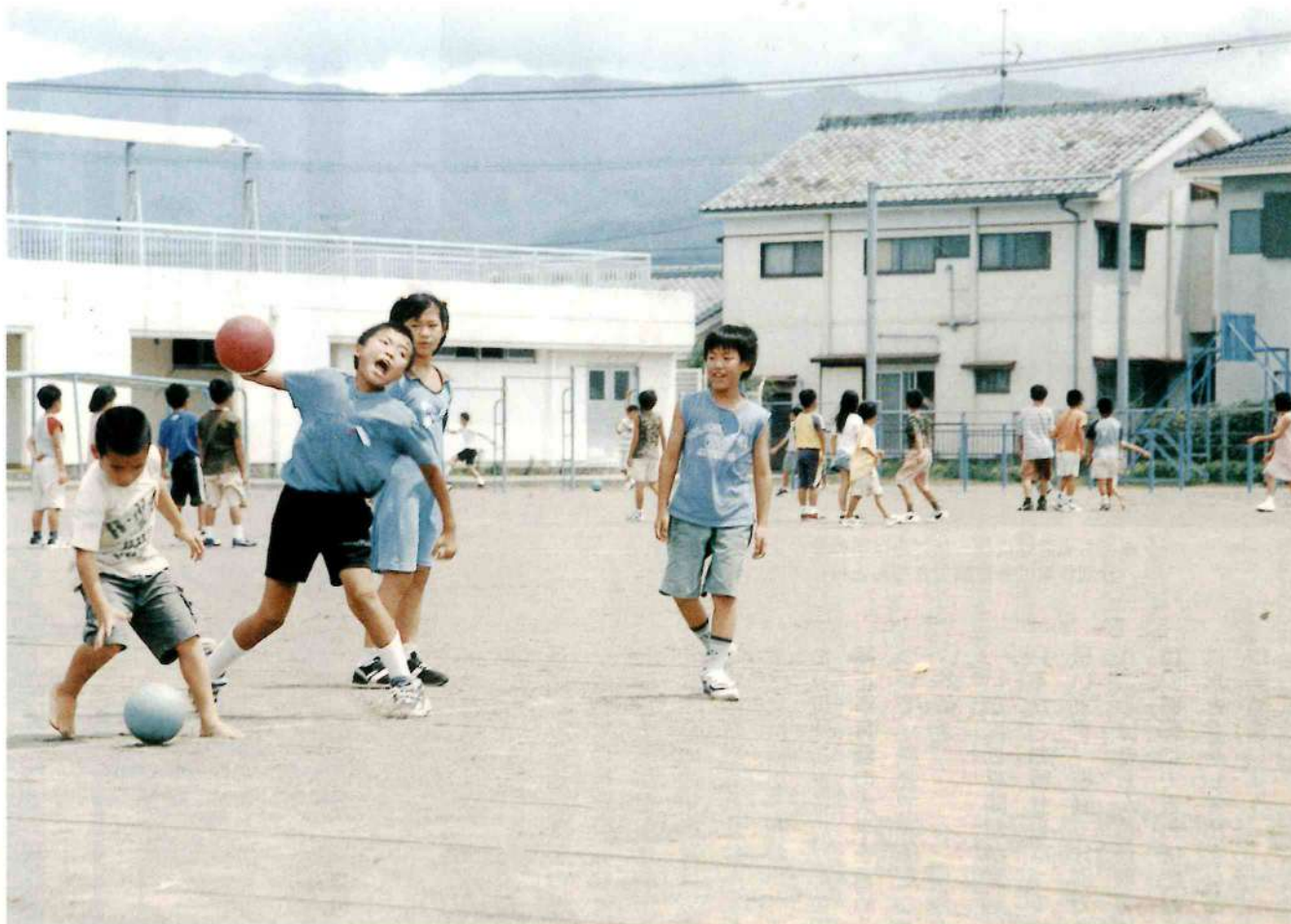
すくすくと元気に育つ子供達。この子供たちの教育について今一度、考え直す時ではないか！？ (8ページに関連記事)