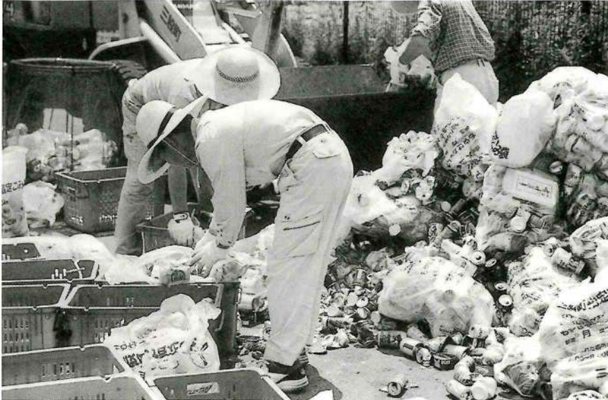
▲ごちゃ混ぜになったごみは手作業によって分別される 分別作業は各家庭できちんとしてほしい

6月議会は、6月12日から6月21日までの10日間の会期で開かれました。可燃ごみ処理委託料の追加を主とする一般会計の補正予算など、4つの会計の補正予算が提案されました。 これらの補正予算は、各常任委員会で集中審議されました。その結果、提案された補正予算のすべてを原案のとおり可決しました。そこで、一般会計補正予算額の大半を占めるごみ問題について、議会で決めたことをお知らせします。 いかにごみ問題が深刻になってきているか、お解りになっていただけだと思います。家庭で分別できるリサイクルごみはきちんと分別をして、生ごみは、肥料にできれば肥料にし、その他は水きりをして出すなどごみの減量化に努めましょう。