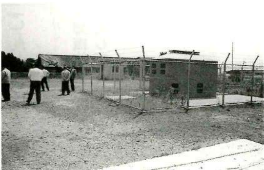
▲温泉ポンプ室に占拠された上米児童遊園

答 上米児童遊園の敷地内に温泉源を掘削し、ポンプ制御室があり、さらには、資源ごみの集積施設があり危険であるため、上米児童遊園を廃止しようと考えている。現在、代わりになる広場を探しているところである。