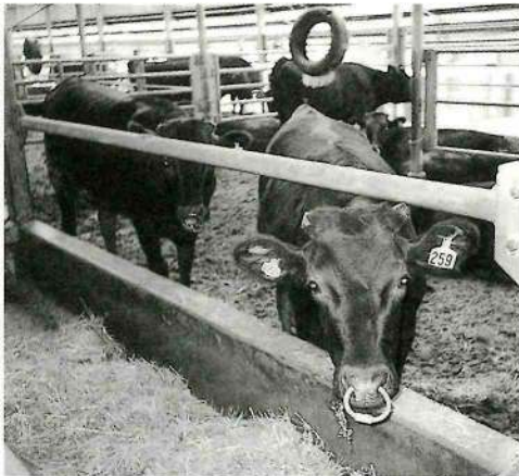
▲口蹄疫による農家のダメージは深刻

伝染病「口蹄疫」が本県で確認されました。それは、農業関係者を脅かし、多大な損害をもたらしました。そこで、農家に対する支援対策を次のように行うことに決め