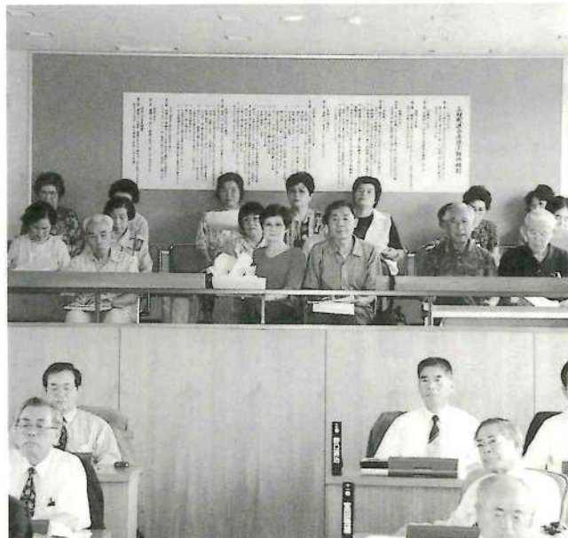
▲議会を傍聴する寿大学の皆さん

6月20日、一般質問が行われた日に、寿大学の約20名の方々が議会を傍聴にこられました。 町民の方々から見た議会とはどんなものなのか、4名の方に感想を書いていただきました。