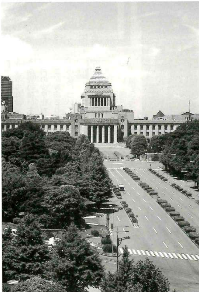
▲中央集権の象徴とも言える国会議事堂