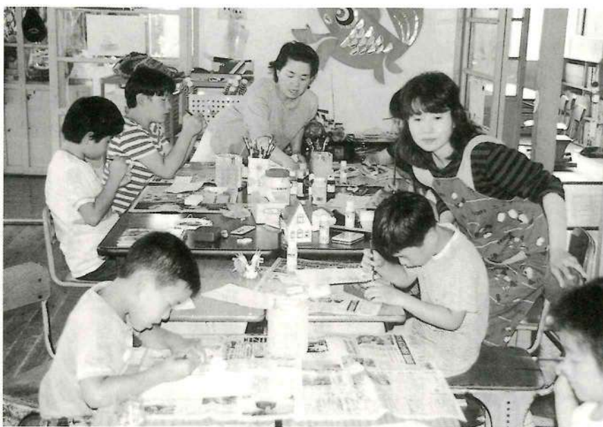
▲▼この子供達が町の将来を担う。少子化対策を早急に！