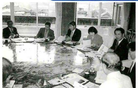
▲嘉穂町議会を視察

嘉穂町議会広報は、「源流」というタイトルで発行されており、表紙の写真には、町内の景色などを用いており大変きれいな仕上がりになっていました。タイトルの