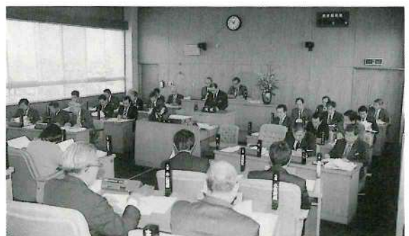
決算の報告を行う町長