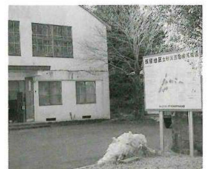
危険区域にある体育館

また、場所的に急傾斜危険地域である。なお、プール用水は水田用水を利用しているところから、家庭雑排水の入り込む危険性があること等の問題点があり、早急に検討していきたい。