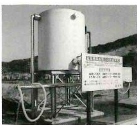
高城町の温泉スタンド