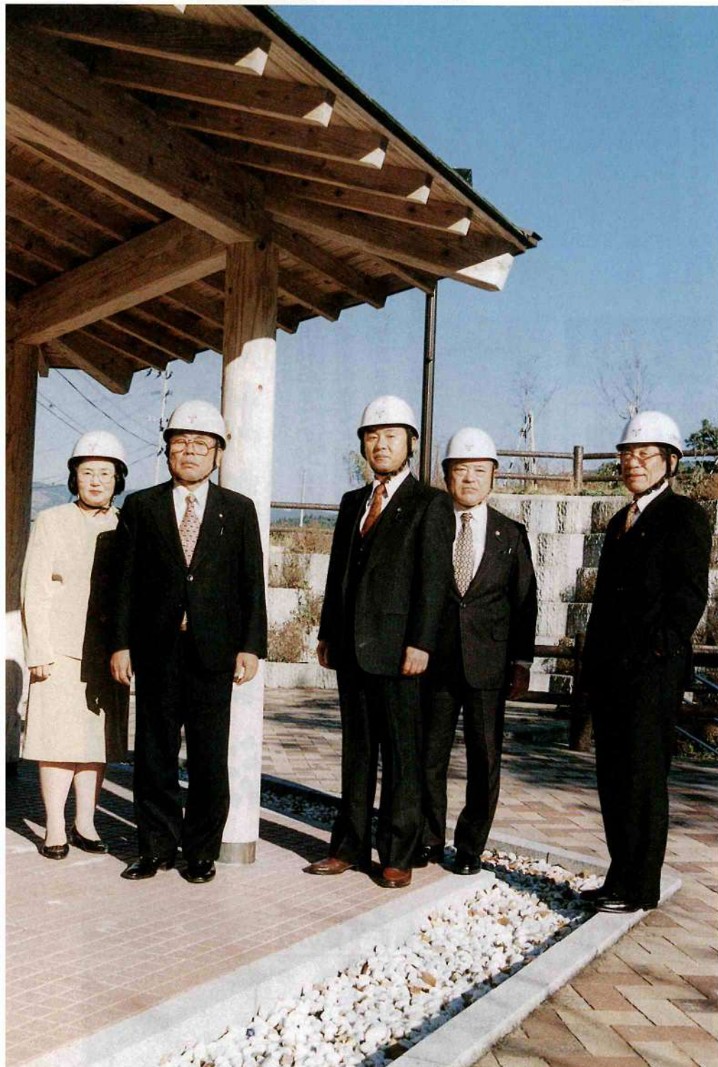
平成9年度事業として整備された長田峡公園を総務委員会のメンバーが視察しました。駐車場の舗装をはじめ、トイレや東屋も新しくなり明るいイメージとなっております。