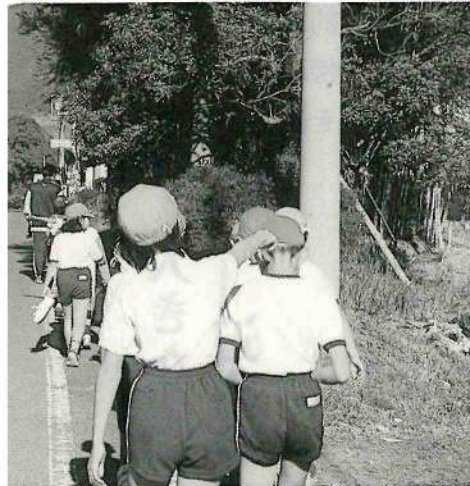
体育館へ向う子供たち

この一般質問は、行政全般にわたり1議員45分以内で行われます。今回は、12人の議員が一般質問を行いました。紙面の都合上、6人の議員のその趣旨だけの紹介になっております。