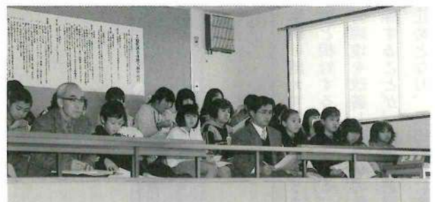
熱心に聞き入る子供たち