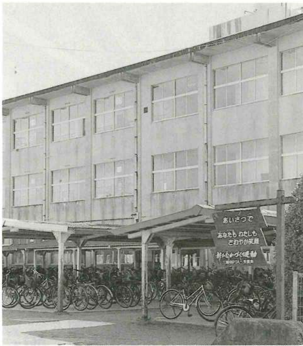
県内一のマンモス校(三股中)