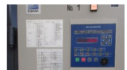
環境制御盤の導入