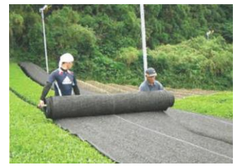
茶の被覆作業の実施