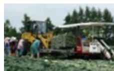
機械化体系の導入