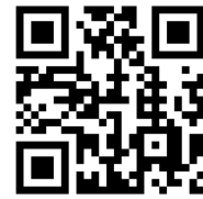
環境省熱中症予防情報サイト