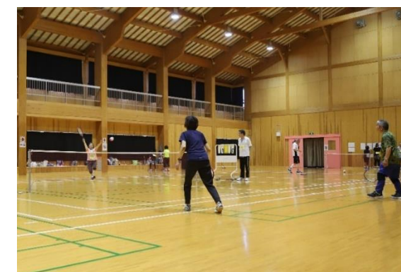
※写真：町民総合スポーツ祭

小型のテニスラケットとビニール製の大きなボールを使って、屋内で行う競技です。バドミントンコートの広さで、1チーム2人でワンバウンドしたボールを打ち合うため、年齢や体力に合わせて気軽にプレーすることができます。