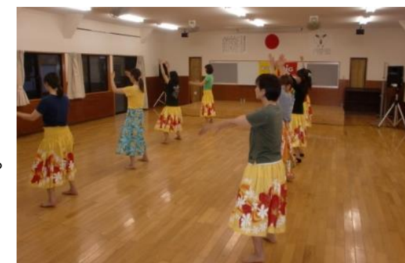
※写真：フラダンス教室のようす

ハワイで生まれた民族舞踊で、癒しのダンスとして多くの人々に親しまれています。ゆったりとしたリズムに合わせ、感情を表現しながら踊るため、心身の健康に効果的です。優雅に見えますが、たえず体を動かすため運動量が多く、シェイプアップ効果も期待できます。