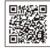
みやざき観光情報 「旬ナビ」