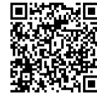
三股町防災アプリ (android)