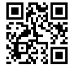
三股町防災ポータルサイト