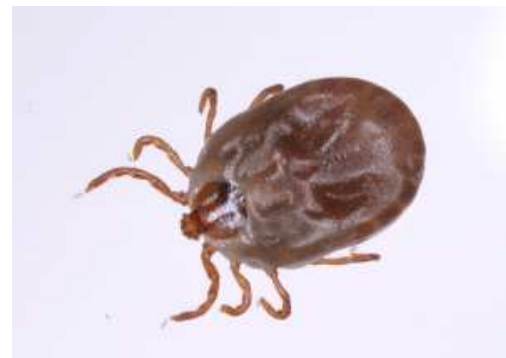
フタトゲチマダニ

例)シカ、イノシシ、野うさぎなどの野生動物が出没する環境 民家の裏山や裏庭、畑、あぜ道など