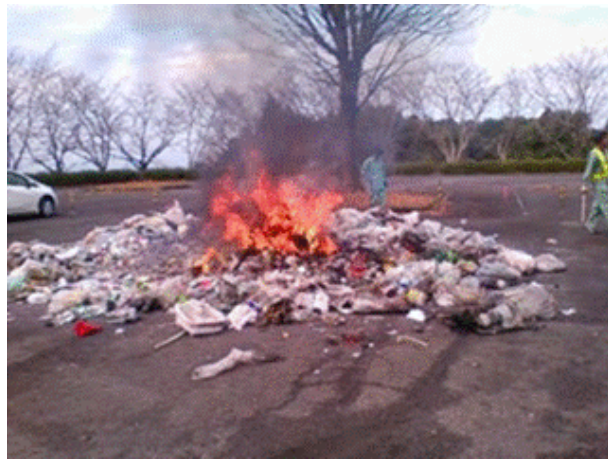
炎上した収集ごみ

危険ごみは燃えないごみと一緒に捨てないで、きちんとガス抜きを行い、 各地区のリサイクル集積所 、もしくは 最終処分場 に持ち込んでください。