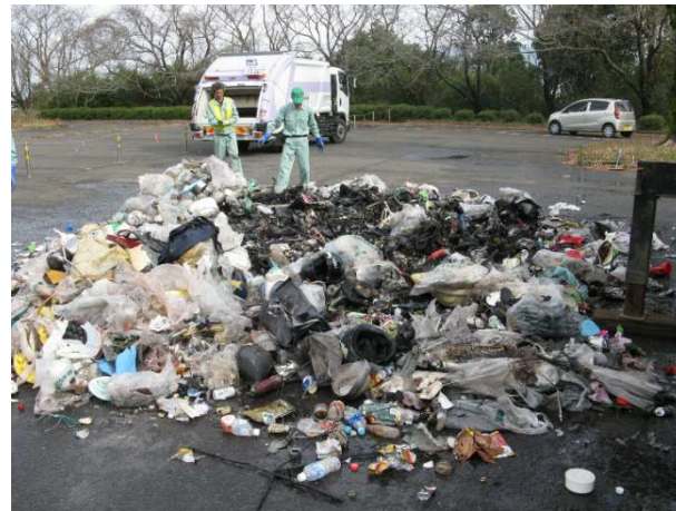
炎上した収集ごみ（消火後）