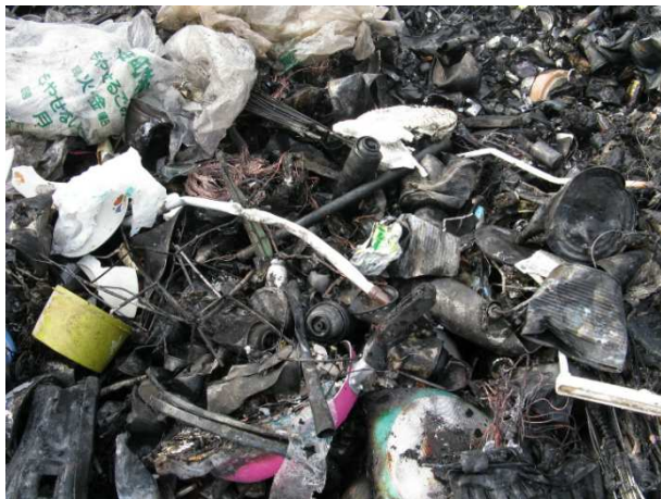
不燃ごみの中に混在するスプレー