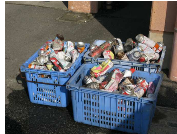
パッカー車1台から回収した危険ごみ