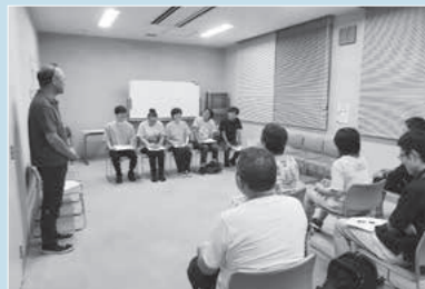
戯曲講座「せりふ書いてみる?」の様子(令和7年度)