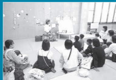
図書館おはなし会の様子

4月28日(火)、都城市立西小学校1年生133人が来館。絵本の読み聞かせを聞き、館内見学を行いました。普段は入れない窓口の中や書庫を見学した子どもたちは、各場所を熱心に見学している様子でした。