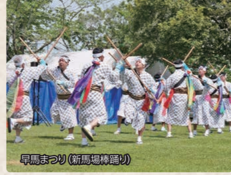
早馬まつり(新馬場棒踊り)