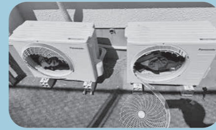
4月 地区分館/室外機 修繕費：約20万円

が減少している現状に照らして実施するものです。 これに伴い、本年度から順次、オンライン申請システムの運用を開始し、窓口に来庁することなく原則全ての行政手続きを行うことができますよう準備を進めています。サービスのレベルを維持しつつ、窓口業務のDX化を含む政策立案や、創造的な仕事に取り組むための時間を確保し、満足度の高いサービスの提供に努めていきます。