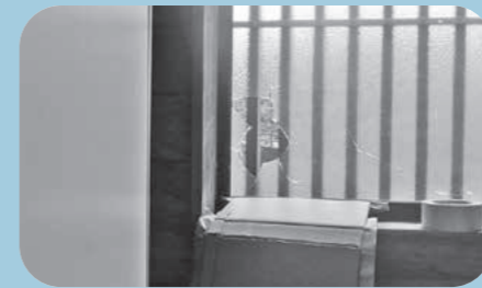
4月 公園/トイレの窓 修繕費：約1万円