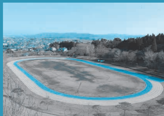
旭ヶ丘運動公園 陸上競技場