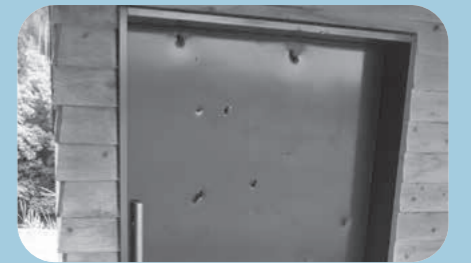
5月 公園/多目的トイレのドア 修繕費：約58万円(予定)

公共施設が今： 現在、町内公共施設の破損が相次いでいます。中には、意図的な破壊行為と思われるものもあります。故意なのか、偶然なのか、真相が分からないものもありますが、現場の状況から故意に破壊された可能性を排除できないものもあり、町は警察への被害届の提出や、破損の程度によって修繕や取替工事を行っています。また、トイレ内でトイレレットペーパーが散乱していたケースなど、修繕や取替工事が必要なくとも、次に利用する人が快適に利用できない事業も確認しています。 先述のとおり、公共施設は私たちの交流・成長・健康づくりの場であるとともに、避難所として防災の要となる、安心・安全な生活に欠かせないものです。このように幅広い役割を担う公共施設の破損は、私たちの豊かで安心・安全な生活を脅かすことにつながりかねません。 私たち一人一人にできるのは、ルールやマナーを守って施設を利用し、次の利用者が気持ちよく利用できるように、清掃などを心掛けること。そしてこのことを、次代を担う子どもたちにしっかりと伝えていくことです。これこそが、私たちの公共施設を守るための抑止力になるのではないのでしょうか。