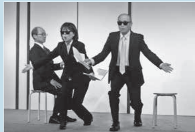
シアターフェスティバルの様子

上演する人形劇団むすび座は、昭和42年に名古屋で創立。以来「子どもと子どもをむすびます。人と人とをむすびます」を合言葉に、心の糧となる人形劇を子どもたちの生活に近い場の上