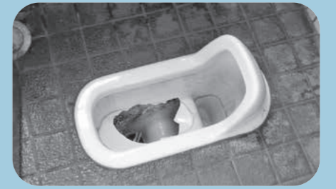
4月 公園/便器 修繕費：約25万円