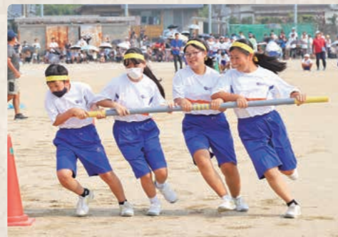
力を合わせて起こせ、旋風