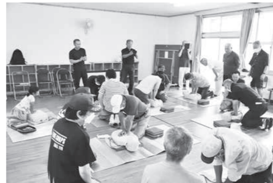
今市の防災訓練の様子

交通事故(人身)発生ワースト順位 ◎県内第4位 / 令和5年7月31日現在(全26市町村中) ※ワースト…悪い方からの順位