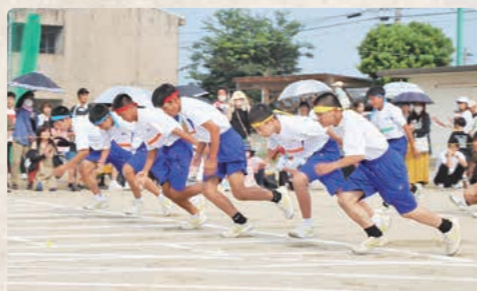
最高のスタート！勝つのは誰だ