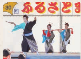
第30回ふるさとまつりの様子