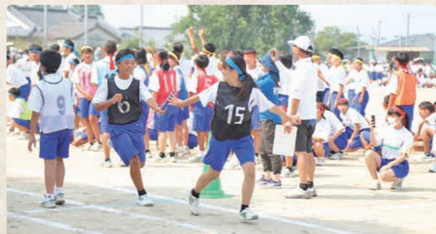
パトンをつなげ！学級対抗全員リレー