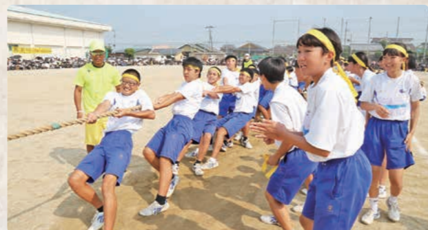
見せる！パワーと三股魂