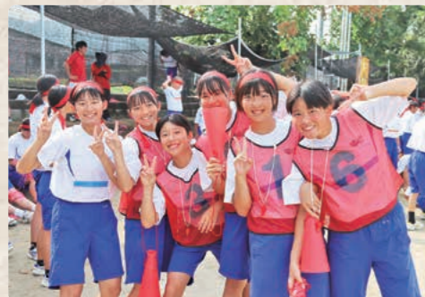
たくさん応援します