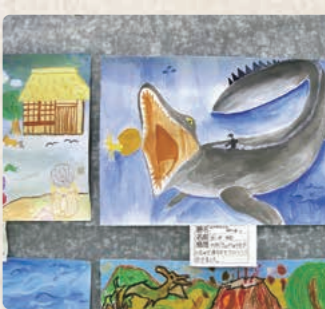
昨年の町文化祭のようす