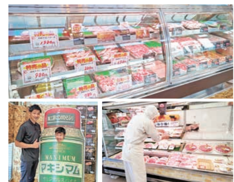
生産者・(株)中村食肉(禅山)

No.638 令和5年10月1日号 発行・編集／三股町 総務課 〒889-1995 宮崎県北諸県郡三股町五本松1番地1 TEL 0986-52-1111 (代表) FAX 0986-52-4944 町公式URL https://www.town.mimata.lg.jp 町FacebookURL https://www.facebook.com/mimatatown