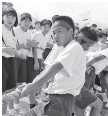
三股中学校体育大会

9月9日、三股中学校で体育大会が行われました。写真は3年生の団技「三股魂!! パワー!!」の一場面です。勝負は男女別、団別の総当たり戦。持てる力とチームワークを相手にぶつけての力比べです。男子が競技をするときには女子が、女子が競技をするときは男子が声援を送ります。勝負が白熱するほどに声援も熱を帯び、じっとしてはられません。今どっちが勝っている? 相手の様子は? 真剣な表情で勝負に挑む様子からは「絶対に勝つんだ」という強い気持ちを感じます。