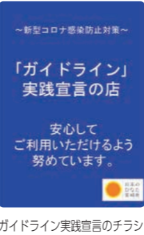
ガイドライン実践宣言のチラシ

9月1日、町長 副町長や町商工会長などが町内の飲食店を訪問しました。これは、新型コロナウイルス感染症防止ガイドラインの内容説明と順守点検を行うためです。このガイドラインは、県が取りまとめた「新しい生活様式」に対応するためのものです。3密対策や入店する際の手指消毒の徹底など感染防止対策を実践している店舗は、「ガイドライン」実践宣言の店として入口などにガイドライン実践宣言のチラシを貼るなどのPRをすることができます。