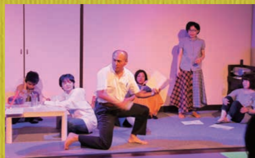
高校演劇部顧問の書き下ろし短編3作品を、町民が高校演劇出身の演出家とリーディング上演します。