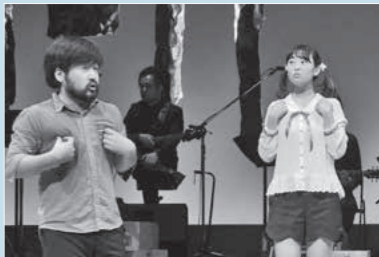
『カチカチ山』本番の様子