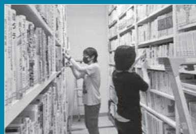
本は大切に…蔵書点検を実施しました