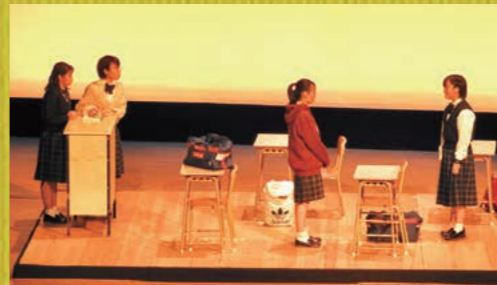
高校演劇出身の劇作家の書き下ろし短編3作品を県内の高校演劇部が上演します。