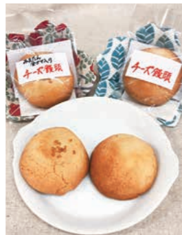
チーズ饅頭/各種1個 100円 製造者/がんばっど!山王原

※みまたん駅前よかもん朝市は10月25日(日)に開催を予定していますが、やむを得ず急遽中止になることもあり得ます。予めご了承下さい。