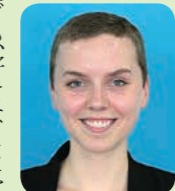
リプリー・キャリア

で、今まではあまり買いませんでした。でも、好きなことをしたいと思ったくないです。だから、今年はためらわずに漫画を楽しみたいです。一つ目は、おにぎりをたくさん食べる事です。もし皆さんも何か食べたかったら、我慢せずに食べればいいのではないのでしょうか?最後に、写真をもっと撮る事です。日常の些細なことにも写真を撮る価値があると思います。この日々を忘れたくないです。みんな、楽しい新年の抱負を立てましょう!