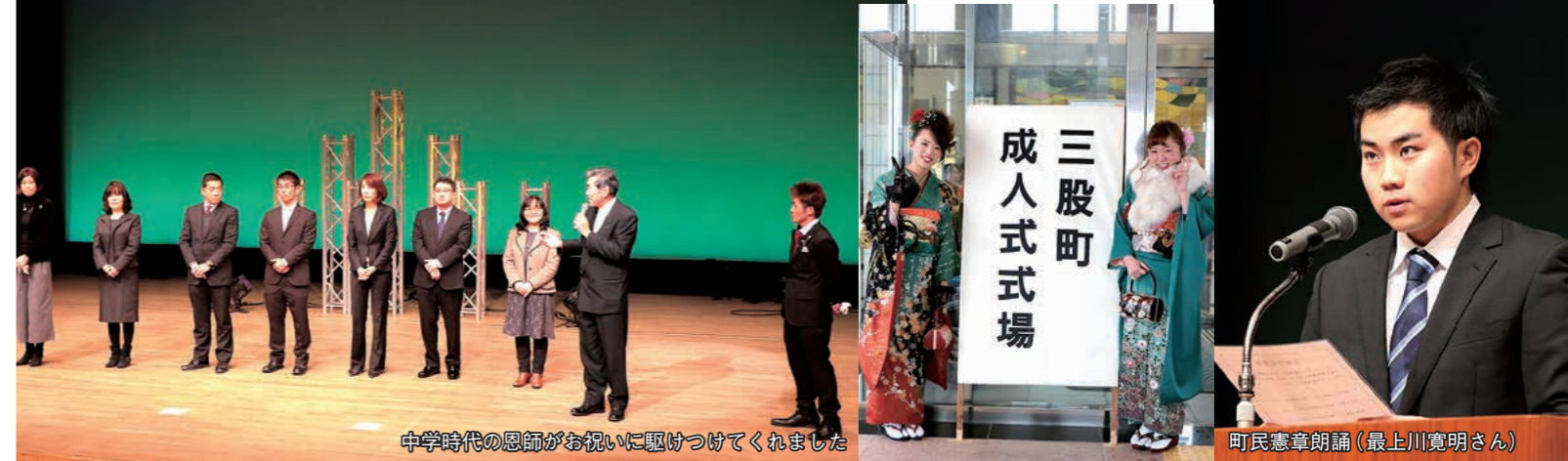
中学時代の恩師がお祝いに駆けつけてくれました