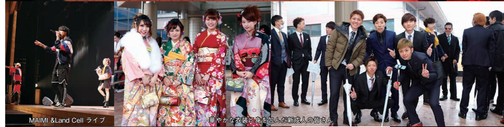
MAIMI & Land Cell ライブ