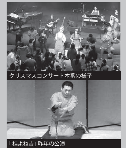
「桂よね吉」昨年の公演

12月23日、「小さな音楽会」による「おいでおいでXmasXmasコンサート」が行われました。「小さな音楽会」は、平成元年に地元音楽家と結成し、たくさんの子どもたちに音楽を届けてきたグループです。