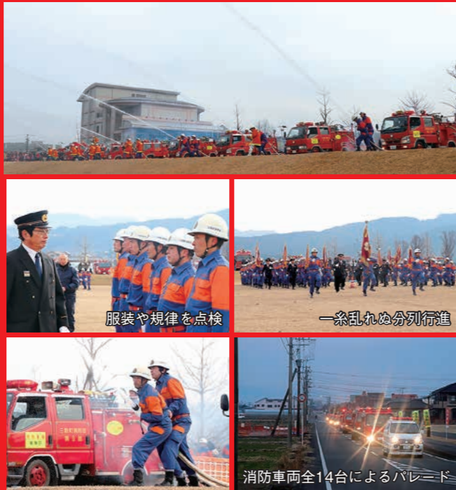
服装や規律を点検