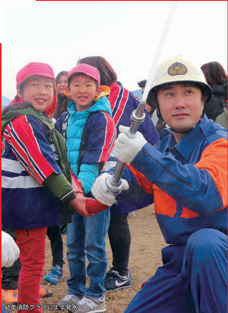
幼年消防クラブによる放水