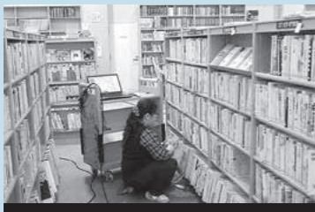
前回の蔵書点検の様子

本の楽しさを子どもたちに伝えるため、全国を巡回している「全国訪問おはなし隊」が宮崎県にやってきました。4トラックのキャラバンカーに、たくさん積まれた絵本を野外で読むことができ、隊員による絵本の読み聞かせも行われます。町立図書館への訪問は、12月3日の午前10時30分から11時30分です。休館案内は、21ページくらしのカレンダーをご確認ください。