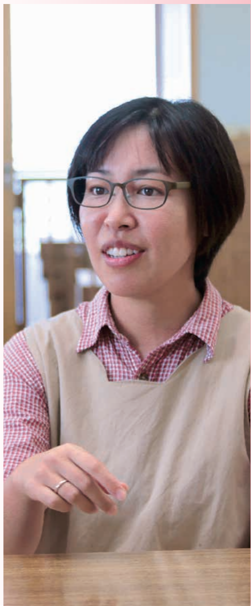
※構音障害・・・年齢に応じた発音が困難である障害。