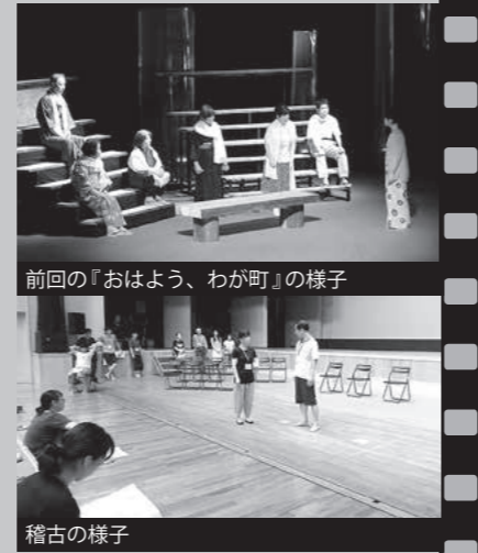
前回の『おはよう、わが町』の様子