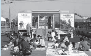
前回のキャラバンカーの様子