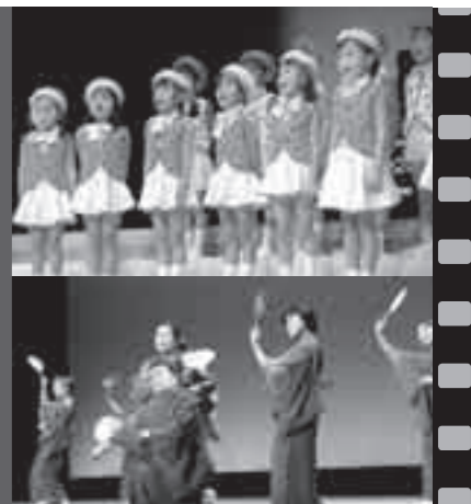
日ごろの活動の成果を大舞台上で発表。写真は昨年行われた文化の祭典