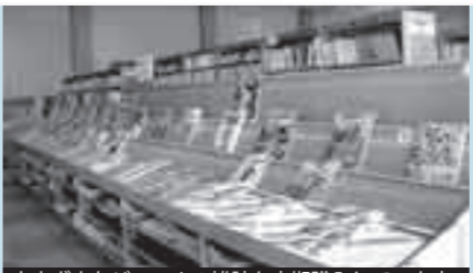
さまざまなジャンルの雑誌を定期購入しています

最新号以外は貸し出しできます 〔週刊誌など〕 AERA・ALBA・オレンジページ・キネマ旬報・九州ウォーカー・クロワッサン・SAPIO・サライ・サンデー毎日・週刊新潮・週刊文春・週刊ベースボール・週刊朝日・Number nono・婦人公論・ワールドサッカーダイジェスト 〔月刊誌など〕 アニメージュ・安心いさいき・一個人・一枚の繪・イングリッシュジャーナル・美しいキモノ・栄養と料理・ESSE・園芸ガイド・演劇ブック・おしやれ工房・おはよう奥さん・おひさま音楽の友・会社四季報・歌壇・ガバナンス・弓道・きょうの健康さよう・料理・暮しの手帖・蛭雪時代・ビジネスアスキー・YOMIURI IPC・猫生活・月刊新聞ダイジェスト・月刊WAN・現代農業・子供の科学・子どものとも012・子どものとも少年版・子どものとも年中向き