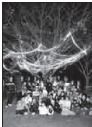
上米公園イルミネーション

12月21日、上米棒踊り若武者会は、上米公園イルミネーションに合わせてどう会場イベントを開催しました(4~5分に記事記事)。 写真は、この日、「夜桜観賞」を訪れた人たちが同会メンバーの皆さん。今年の年末もたくさん笑顔で上米公園が満開になればいいですね。