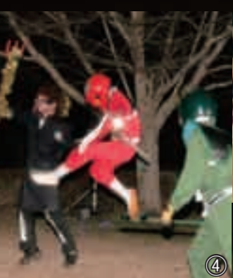
12月21日には、イベントを開催。上米棒踊り(写真①)、マジックショー(写真②)のほか、ミマタレンジャー(写真③④)も応援に駆けつけ、来場した子どもたちは大喜び