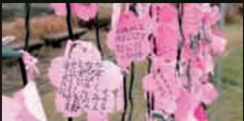
期間中、訪れた人たちは、桜の花びらをかたどった紙に、願いごとを書いていた

先月号で紹介しました上米公園の「冬の夜に咲く桜」。上米棒踊り若武者会が「地域を盛り上げよう」と取り組んだイルミネーションです。今回は、この活動を写真で紹介し、実際に取り組んだ彼らがどう感じたのか、そして地域への思いを取材してみました。