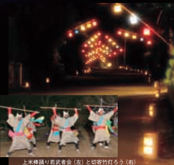
上米棒踊り若武者会(左)と切寄竹灯ろう(右)

現在、まちづくりには「協働のまちづくり」が叫ばれていますが、これは、住民と行政が同じ目的(＝誰もが快適に生活できるまち)に向かって、それぞれが責任と役割を持ち、共に協力し合い、まちづくりを進めていくという意味です。例えば、交通安全やごみ問題はその代表例。物があふれる時代となった昨今では、一人ひとりの責任と役割、行政の責任と役割が相乗して安全で快適な環境の地域づくりにつながります。そして、上米棒踊り若武者会や切寄竹灯ろうのように、住民発信による地域づくりの企画・展開は、地域の個性や新たな担い手を生み出し、さらにはつながりを強化し、それらが活気あふれる特色あるまちづくりにつながっていきます。そのため町は、地域づくり活動を行っている、またはこれから活動しようとするさまざまな団体へ、よりよい地域づくりへのきっかけをつくるために補助金を交付しています。