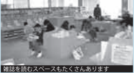
雑誌を読むスペースもたくさんあります