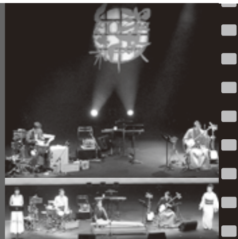
「和の伝統」。日本古来の情緒豊かな音楽に会場もうっとり

交通事故(人身)発生ワースト ◎県内14位 /平成20年8月31日現在 (30市町村中ワースト1悪い方からの順位)