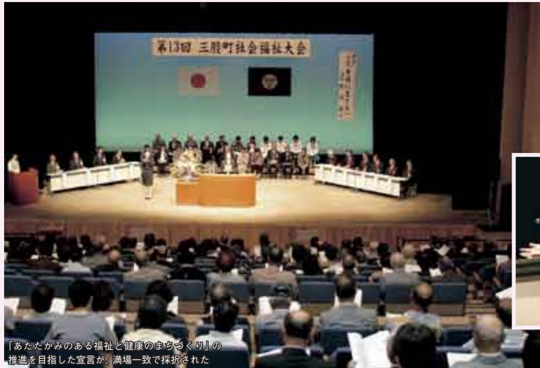
「あたたかみのある福祉と健康のまちづく切」の推進を目指した宣言が、満場一致で採択された