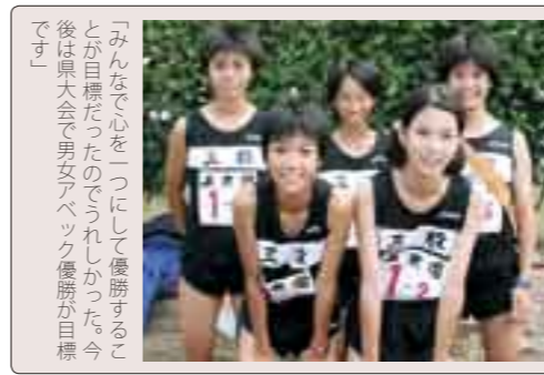
「みんなを心をつないで優勝することが目標だったのでうれしかった。今後は県大会で男女アベック優勝が目標です」

り広げる選手たち。沿道からはチームに関係なく温かい声援が送られていました。 三股中駅伝部は、女子Aチームが35分20秒のタイムで見事2連覇。男子Aチームは1時間5分56秒で2位に入賞するという好結果で、女子では3区、男子では5区と7区が区間賞を獲得するなど、大健闘をみせました。また、男子の優勝は帖佐中(鹿児島県)が1時間5分43秒でした。