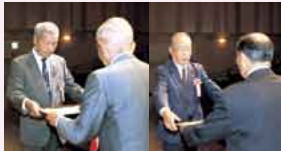
町長表彰(右)、さんさんクラブ会長表彰(左)で賞状を受ける受賞者