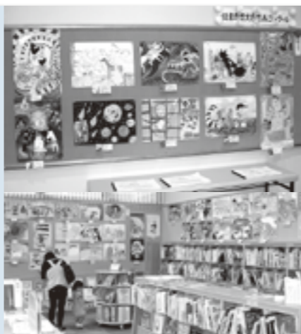
読書感想文・感想画コンクール入賞作品を図書館内に展示しています!