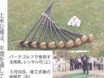
パークゴルフで使用する用具。レンタル可（上）

上米公園は、年間を通して世代交流ができる「ふれあい公園」として位置づけられていて、今後も遊歩道の整備などが計画されています。 パークゴルフ場利用詳細 開場時間 午前8時30分～午後5時 ※季節により開場時間が変わる場合があります。 利用料金 1回（18ホール）中学生以下200円（終日300円）、高校生以上300円（同500円） ※月曜休、用具レンタル有り お問い合わせ 教育課 生涯学習係 ☎52-1111（内線431）