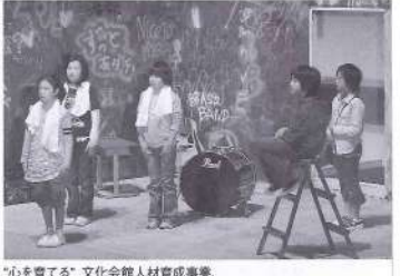
"心を育てる"文化会館人材育成事業、演劇ワークショップ「みまた屋」

て、町民の生活に根づいた文化の振興や創造、育成、保護、継承を図り、人間味豊かな個性あふれる地域づくりを推進します。 人をはぐくむ 古くから「文教のまち」として知られる三股町は、現在も文教精神が脈々と受け継がれていて、「人を育てる」教育が町内各学校や地域で行われています。 町は、まちをつくる人を育てるため、家庭や学校、地域社会の連携融合を図り、地域ぐるみでの豊かな心の育成を目指します。 また、ふるさとに誇りを持つ人材さらにはふるさとづくりに積極的に取り組む人材を育てるため、郷土学習や体験学習の機会づくりに努めます。このほか、喜びと生きがいを感じるができる生涯学習の場づくりを目指し、学習活動の総合支援を行います。