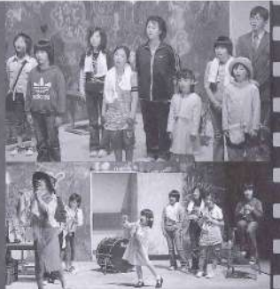
3月26日、見事な舞台をつくり上げた「みまた座」の子どもたち(写真上/下)

※ 贖いとは、罪を償うという意味。 ここに掲載してある手記は、交通事故を引き起こして刑務所で罪の償いをしている人たちの職務の記録です。 一瞬の過ちによって、家族、恋人、友人など愛しき人々から離れられ、自ら犯した罪を反省している様子が文筆の端緒から伝わってきます。 このような悲惨な事故を引き起こさないよう、心の戒めにしていただきたいと思います。 [財団法人交通安全協会提供]