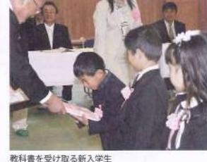
教料書を受け取る新入生

町国民健康保険病院東側に（社）三股町シルバークプラザ（シルバープラザ）が建設され、4月4日、同地で開所式が行われました。 同センターは、社団法人として平成5年10月に発足。以来、高齢者に雇用場を設けることで、生きがい作りや社会参加を支援しています。 また、介護予防や疾病予防にも大きく貢献。今後も、高齢者の活動拠点としてますます活用されることで、高齢者福祉の増進が期待されます。