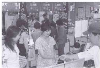
各地で物産展を開催し、特産品をアピール

農畜産業の振興 農畜産業は本町の基幹産業である一方、厳しい経営環境に置かれていることから、生産性の高い安定した経営、経営基盤の整備、後継者の育成、三股ブランドの確立、農業者年金制度の充実などに努め、経営環境の強化を図ります。