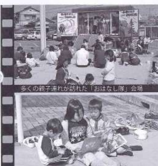
多くの親子連れが訪れた「おはなし隊」会場

「みまた座」公演ワラ話... 劇団こまぐら劇場の講師らと一緒に、楽しいけいこを続けてきた演劇ワークショップ「みまた座」2期生の子どもたち。小さな役者たちがついに、3月26日に本公演を迎えました。 体調を崩す団員も少なく、集中的なけいこも消化することができました。子どもたちのあり余るほどのパワーにほんろろえられたり、一時休團する団員がいたりで、どんな公演になるのかと職員や保護者はハラハラ...しかし、講師らは構えることなく、個々の良い面を引き出していました。 本番2日前、舞台に組まれたセツトを目の当たりにした子どもたちは、現実的な重圧を感じたのか、みるみるうちに目の色が変わりだし、本番では見事な舞台をつくりあげました。 公演に訪れた観客からは、「子どもたちの生き生きとした表情が良い」「子どもたちの未来に役立つ事業」という意見をいただきました。 文化会館運営委員会開催 3月14日に文化会館運営委員会を開催し、よりよい「活きた」会館づくりについて協議が行われました。 委員は住民の代表7人。「もったい地域の人々が利用しやすく、気軽に楽しめる雰囲気づくりと、文化の芽が育っていくような事業企画が今後必要」となどの意見が出されました。 文化合同展大盛況 3月14日から19日まで町文化協会主催による「第19回三股町文化合同展」が開催されました。 絵画、書道、木目込み人形、短歌などの力作がボワイエに展示され、ロビーには写真をはじめ、来館者を歓迎するよう生け花やアートフラワーが色鮮やかに飾られました。 また、茶道部による抹茶も振る舞われ、日本文化の一端に触れる貴重な空間を提供していました。