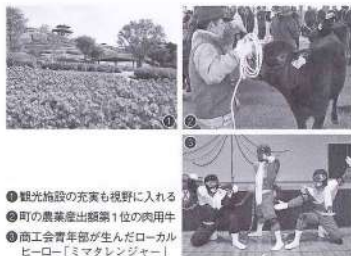
①観光施設の充実も視野に入れる ②町の農業産出額第1位の肉用牛 ③商工会青年部が生んだローカルヒーロー「ミマケンジャ」