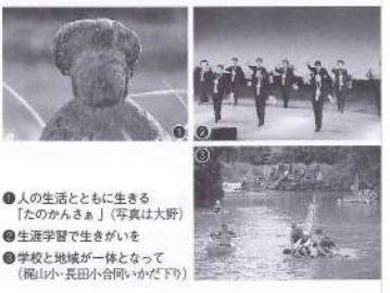
●人の生活とともに生きる「たのかんまゐ」（写真は大野） ●生涯学習で生きがいを ●学校と地域が一体となって（龍山小・長田小合同いっか下り）

文化をはぐくむ はるか昔、人は言葉を生み出し、火をおこしました。以来、時代とともによりよく生活するために、あまたの知恵を重ねてきたのです。 人の生活とともに歩んできた「文化」という名の知恵。ともすれば人の営みそのものを「文化」と言えるかもしれません。 本町には、各地域に伝承されている伝統文化や、親しみやすい芸術文化などといった、「町民とともに歩む文化」が多く存在します。 町はこれらを、総合文化施設をはじめとする各関連施設を拠点とし