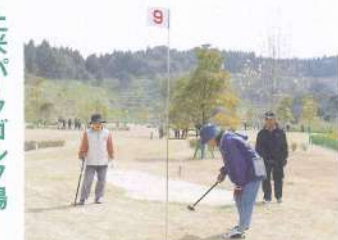
パークゴルフ場利用詳細

上米公園は、年間を通して世代交流ができる「ふれあい公園」として位置づけられていて、今後も遊歩道の整備などが計画されています。 パークゴルフ場利用詳細 開場時間 午前8時30分～午後5時 ※季節により開場時間が変わる場合があります。 利用料金 1回（18ホール）中学生以下200円（終日300円）、高校生以上300円（同500円） ※月曜休、用具レンタル有り お問い合わせ 教育課 生涯学習係 ☎52-1111（内線431）