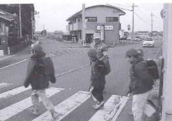
町内各小学校区で活躍する「みまもり隊」(写真は勝間)