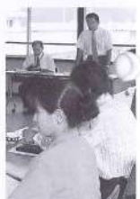
町民とともに進めるまちづくり (写真4行政改革推進委員会)