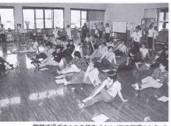
笑顔で過ごすための健康づくり（健康管理センター）

の適正に努めます。 笑顔で過ごすための健康づくり 各医療機関や健康管理センターの機能を生かし、連携を図りながら、健康管理に対する支援や医療体制の充実などに取り組み、生涯笑顔で過ごせる町民の心と体の健康づくりを推進します。 また、生活習慣病や感染症の予防、高齢者・母子保健など、保健衛生面への対応の充実を図り、町民一人ひとりが状況に応じて自主的な健康づくりに取り組むことができるよう努めます。 このほか、町民がそれぞれの目的に応じて楽しめるスポーツ活動やレクリエーション活動の振興・充実を図り、スポーツ・レクリエーションを通じた地域づくりや交流活動を推進します。また、町民がこれらを気軽に親しめるよう、施設などの整備・充実を図ります。