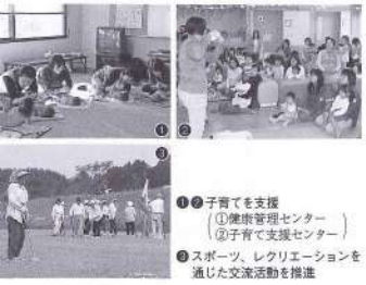
①子育てを支援 ①健康センター ②子育て支援センター ③スポーツ、レクリエーションを通じた交流活動を推進

町民すべてが生涯を通じて活力ある充実した生活を営むことができるよう、町民一人ひとりが地域福祉の担い手であるという意識を持ち、共に支え合い生きがいの持てる社会環境づくりに努めます。 そのため、児童福祉、高齢者福祉、障害者福祉、母子・寡婦・父子福祉、低所得者福祉、勤労者福祉について、それぞれの現状や課題に応じた施策を推進します。 また、暮らしや健康を共に支え合う社会保障制度である、介護保険、国民健康保険、国民年金制度