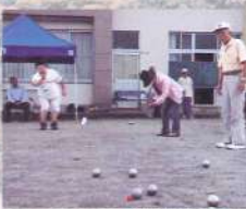
新種目のベタンク。金属製のボールをピュットという赤い玉に近づける