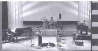
22日、聞いたことのあるメロディーに会場は静かになった。

● 謝罪とは、罪を償うという意味。 ここに掲載してある手記は、交通事故を引き起こして刑務所で罪の償いをしている人たちの最後の記録です。 一瞬の過ちによって、家族、恋人、友人など戦しき人々から隔離され、自ら犯した罪を反省している様子が文藝の魂から伝わってきます。 このような悲惨な事故を引き起こさないよう、心の成長に努めていただきたいと思います。 【東京交通安全協会提供】