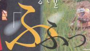
～パリヤーンwithフレンズ in 宮崎2005～

ジャズピアノリスト谷川賢作と ハートフル続木力の2人で 精力的にライブ活動をする 「パリヤーン」と その仲間たちによる 優雅な秋の夜を。