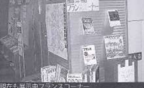
現在も展示中フランスコーナー