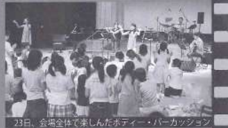
23日、会場全体で楽しんだホディー・パークセッション