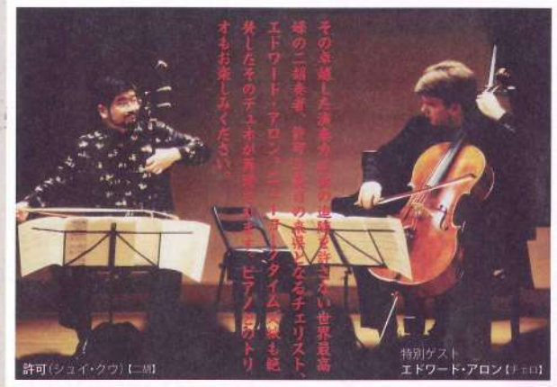
許可(シュエイクウ) (二胡)