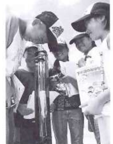
透視度計をのぞく子どもたち

夏休みの自由研究。5人の子どもたちが、下水道の仕組みを研究課題に取り上げました。写真は、中央浄化センターで処理された、放流直前の水の透視度を調べる子どもたち。1メートルの透明な筒に浄化水を入れて、底に描かれている十文字が見えるかを調べました。