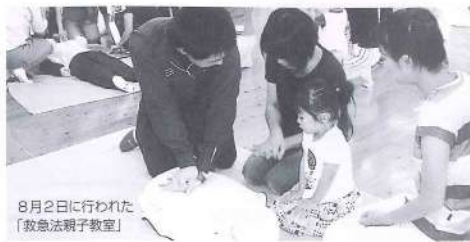
8月2日に行われた「救急法親子教室」

今月のうた とんぼのめがね 一、とんぼのめがねは 水いろめがね 青いおそろをとんだら とんだら 二、とんぼのめがねは びかひかめがね おてんとさまをみてたら みてたら 三、とんぼのめがねは 赤いろめがね タやけをよんだら とんだら