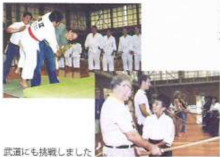
武道にも挑戦しました (7月30日、スポ少交流会 武道体育館)