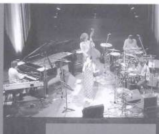
今後多彩な内容をお届けします (写真は昨年の自主文化事業)

※願ひとは、罪を償うという意味。ここに掲載してある平記は、交通事故を引き起こして刑務所で罪の償いをしている人たちの最後の記録です。一線の間によって、家族、恋人、友人など親しい人々から断絶され、自ら犯した罪を反省している様子が父親の痛罵から伝わってきます。このような悲惨な事故を引き起こさないよう、心の戒めにしていただきたいと思います。 (財団法人交通安全協会提供)