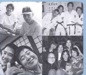
空手で出会った仲間たち

オーストラリアではいろいろな武道や武術が人気で、私も大学の時から合気道をしていました。三股町に来てすぐ、よい空手の先生に出会って、彼の道場に入りました。ほかの交流員や英語の先生もいるので、外国人と日本人の友達もできて、一緒に楽しく空手を学んでいます。ぼくの日本の思い出は、空手が主を占めています。空手だけではなく、「温泉に入る技」や「ふんどしをはく技」も教えてもらいました。残念ながら保育園で役に立つ「カンチョウ」のブロック技はまだ習っていません。