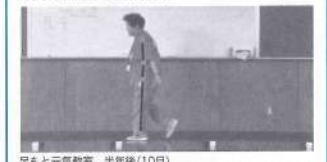
足もと元気教室 半年後(10月) 着がゆがり、曲げみの姿勢がよくなりました。姿勢がよくなりました。