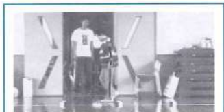
足もと健康教室 開催当初(5月)