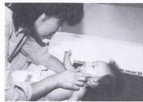
①: 調子はどうですか? (写真上) 赤ちゃんを見ながら、お母さんの調子にも気を配る

予防接種など気になっていたから、丁寧に教えてもらって安心しました。専門の人だから安心して相談できますよね。