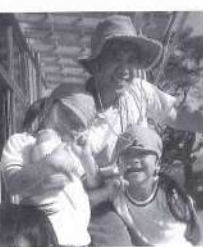
ひまわり保育園児と遊園地に行ってきました

もう三股に来てから2年が過ぎたので、スパーに行くときに知っている人や子どもたちによく会います。その子どもたちは僕を見ると、声を掛けてくれる子もいますが、恥をかいて逃げる子もいます。たまに今日買ったお菓子のほうに興味を取られて無視する子もいます。ある日4歳ぐらいの女の子がおばあちゃんと一緒に来て、僕を見るとすぐに僕の腕を抱きしめてきました。でもおばあちゃんはずっと変に思われたのか顔をしかめて僕を見ました。彼女は「いったいこの知らないおじさんは私の孫とどんな関係なの?」と思っはすでした。お孫さんが説明しても信じていないみたいでした。