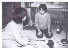
③: どこか気になるところありますか? (写真上) お母さんが赤ちゃんの体で気になる場所を相談