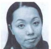
神水流じん子 (劇団25馬力)