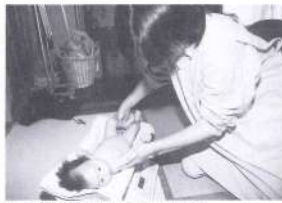
②: ちゃんと体重増えてますね! (写真上) 赤ちゃんの体重の増減には個人差があることをお母さんに説明