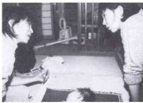
④: 健診ではこんなこともするんですよ (写真上) 健診や各種母子教室の説明をし、悩みはすぐ相談することを促す