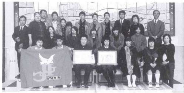
三股町ジュニアリーダークラブ 善行賞

同会は、平成7年7月から小学生を対象にレクリエーションの楽しさと団体活動の意義などを指導。早馬健雲太鼓の伝統芸能継承活動を行い、老人ホームの慰問をはじめ、町内の各地区敬老会や運動会など各種イベントに積極的に参加され、世代間交流活動に力を注ぐなどし、町民の模範となる活動を行われています。