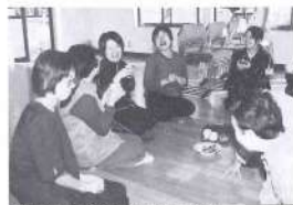
市つとむと息、こんな楽しい時間も大切