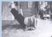
自宅で体操。イチ、ニイチ、ニ。

教室のみんなと話すことがすごく楽しいです。毎日でもあれば行きたいですね。「あなたはもう来なくていい!」って言われるまで、続く限り行こうと思っています! こんな教室を開いてもらってよかったです!