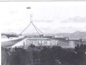
オーストラリアの国会議事堂

今年台風が多かったですね。オーストラリアには、全く来ないからよっと怖かったです。10月にオーストラリアで連邦政治の総選挙を実施します。オーストラリアでは18歳以上なら投票が義務になって、投票しないといふ50ドルの罰金を払います。旅行や外国に行っている人は投票しなくてもいいですが、やりたい人は大使館や郵便でできます。でも誰に投票するかは難しいですね。