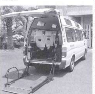
移送サービス用の自動車。普通免許で運転できます。

一般の交通手段の利用が困難で、車いすを必要とする重度の身体障害者の外出を支援する移送サービスを開始しました。普通免許を持っている人なら、誰でも参加できますので、ぜひご協力をお願いします。