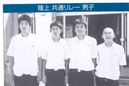
陸上 共通リレー 男子