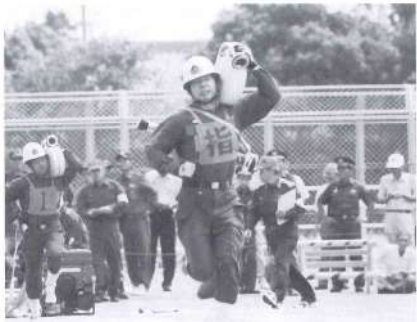
「走れー!!」応援団のゲキが飛び