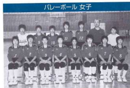
バレーボール 女子