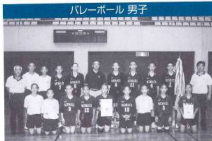
バレーボール 男子