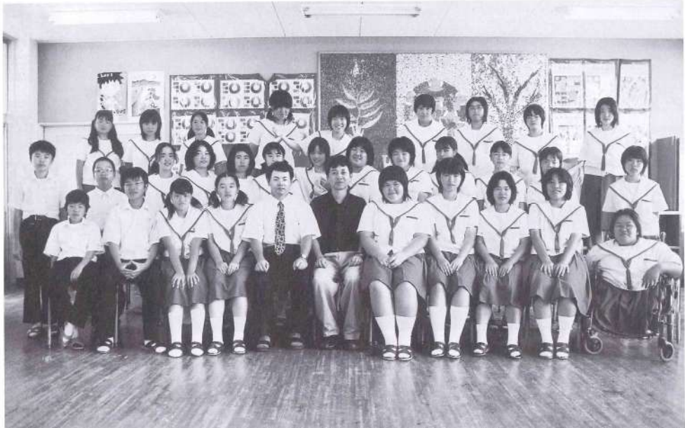
メンバー/仲良く楽しく元気良く 部員数/36人(3年19人・2年9人・1年8人) 主な戦績/H16.5 都北地区美術の衛生ボスター第2位 H16.7 宮崎県中学校デザイングランプリ大賞 H16.8 都北地区中学校美術部合同展参加