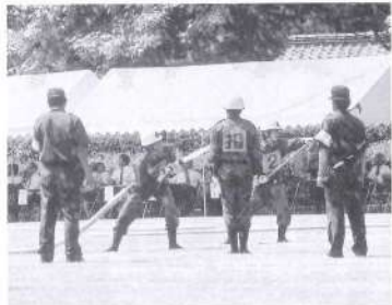
見事な操法を見せた第2部(市郡大会)