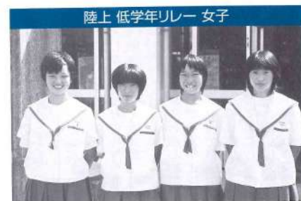
陸上 低学年リレー 女子