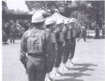
市郡大会惜しくも2位の機動本部