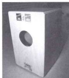
カホンの裏面。中央の穴は共鳴用に開いている