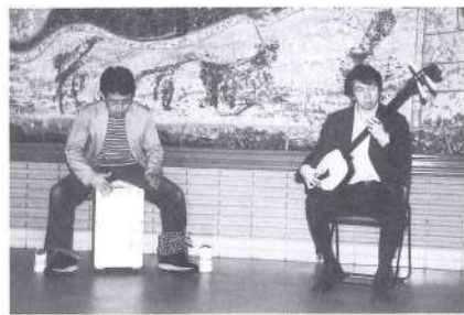
役場ロビーで演奏する両氏