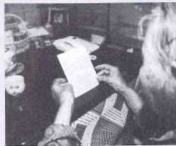
ちよつと待つ!電話する前に確かめましょう!

最終受付期限 平成16年7月〇日 00-0000-0000 担当直通 00-0000-0000 00-0000-0000 受付時間 平日(午前9時～午後3時) 〒000-0000 東京都東区0-0-000 株式会社 日本○○管理協会 ※尚、重要書類等はご入金確認後の郵送となりますのでご承知願います。