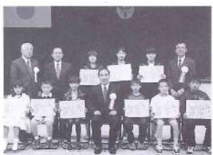
「人権に関する標語」受賞者の方々

町青少年育成町民会議主催による「子どもの声を聞く会」は、11月3日、文化会館で開かれました。これは子どもたちの将来についての意見や日ごろ考えていることなどを発表してもらい、今後の青少年育成に生かしていくとういうもので、各小学校から児童6人と中学校の生徒2人が元氣よく意見を発表しました。出席した民主団体の代表や小中学校関係者など約400人が、真剣な表情で発表に聞き入っていました。