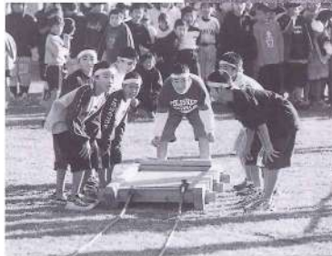
恒例「人間早馬競争」。子ども大人も歯を食いしばって力走!