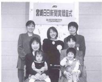
笑顔で贈呈式に。おめでとうございます!