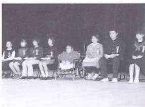
「子どもの声を聞く会」意見発表者