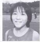
「自己新を目指して」 私たちが三股ジュニア陸上はできたばかりのクラブです。練習は毎週土曜日、旭ヶ丘運動公園であります。練習は、きついけど友達と楽しく走っています。みんな一生けん命自己新を目指してがんばっているところです。監督やコーチがやさしく指導してくださるので、私たちと一緒に走りませんか?

陸上競技 三股ジュニア陸上クラブ(団員数・28人) 練習時間/土曜日午後3時00分 練習場所/旭ヶ丘運動公園陸上競技場