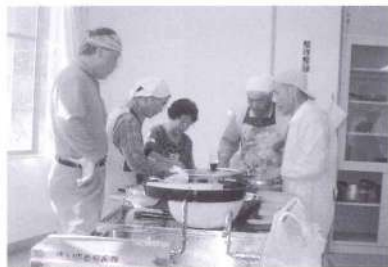
3品を手際よく調理しました