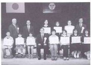
「親と子のふれあい標語」受賞者の方々