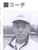
「コーチ クラブ発足から7カ月。子どもたちは楽しく練習に励んでいます。現在まで、基礎体力(筋力・持久力・瞬発力等)の養成を主とした練習をしてきました。競技会にはこれまで6回出場しましたが、そのたびに好記録が出るなど、随所で体力の向上を感じています。今後は、体力に応じ練習を工夫し、陸上競技を通じて、スポーツの好きな子どもの育成に努めたいと思います。 今回でスポーツ少年団紹介は終わります。」