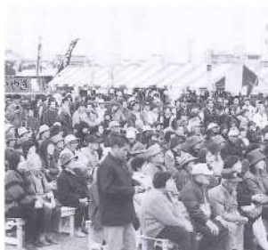
ステージ前は満席。思わず足を止める人も