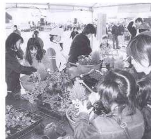
線と花で潤いを。「親子ガーデニング教室」開講