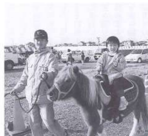
ポニー体験乗馬が初目見え