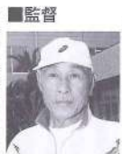
「陸上競技を楽しく」 陸上競技は全体的なスポーツ力を確立するに役立ちます。クラブでは、将来オリンピック選手を送り出すことを目標に頑張っています。子どもが陸上競技を楽しく思ってくれれば、練習内容や友達と仲良くすること、練習が楽しくできる環境づくりなど、母集団と共に取り組んでいます。『自分で出来ることは自分でやる』良い子どもに育ってほしいことを希望しています。 「スポーツ好きな子どもの育成を」