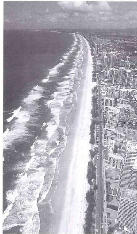
太陽に照らされて金色に光るといふ、ゴールドコーストのビーチ。