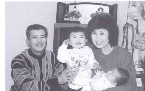
私と妻、それに二人の孫です

薫風の五月が過ぎ、梅雨の六月になりましたが今は昔と違いすでに田植えも終わり、かなり成長した緑の稲が一面に広がっています。私の子どものころは、梅雨時が田植えだったのになあ」と思い出しながらベンを走らせています。私が三股を後にしたのは、中央大学に入学する直前の昭和三十一年の三月でしたから、もう四十四年の歳月が流れてしまいました。まさに「光陰矢の如し」です。大学入学に際し、勉学はもちろんですが、自分で目指したもう一つの目標は、関東大学箱根駅伝大会に出場することでした。箱根駅伝の歴史をひもといてみても分かる通り、戦後の中央大学は常に優勝候補に名を連ね、選手として出場すること自体が大変なことでした。在学四年間で一度でいいから箱根駅伝に出場したいという願望は、苦しい練習も励みにかえることができ、昭和三十四年の第三十五回大会で優勝することができました。今でいう花の2区を走ったことでしたから、誠に幸せなことでした。この優勝をきっかけに六連覇とい