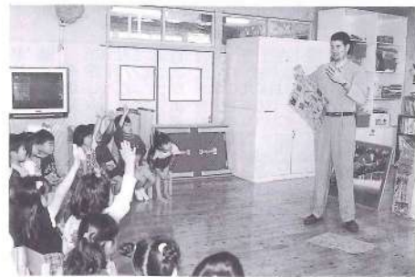
すみれ保育園で子ども達とふれあいました。オーストラリアのことについて興味があり、たくさん質問をしてくれて楽しかったです。

1993～97年の間にオーストラリアで溺れて死んだ観光客は56人です。皆さんも気をつけてください。いくら優秀なビーチの監視員がいるといっても、最後に自分を守るのは自分の責任ですから！！