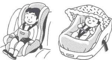
幼児用シート (4か月～4歳)