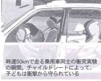
時速50kmで走る乗用車同士の衝突実験の瞬間。チャイルドシートによって、子どもは衝撃から守られている

いざチャイルドシートを準備しようとしても、「正しい選択、正しい装着」ができなければ効果を上げることはできません。取扱説明書に従い、次のことにもご注意