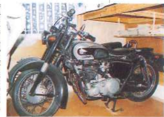
「メグロ」社製のオートバイ「陸王RQ」