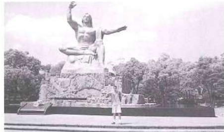
平和公園 (ポーズにも意味があるのですね)