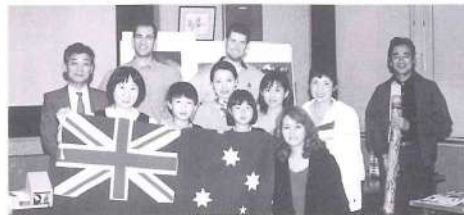
都城でオーストラリア国の紹介をしました。

そのあとバスに乗って、長崎に行ってきました。最初、浦上天主堂に行って、次にグラバー園にも行きました。庭がとてもきれいで展望台から長崎の景色が良く見えました。本当に感動しました。その後、平和公園でランチをゆっくりとりました。最後に、原爆資料館に行きました。原爆があったことは知っていましたが、写真やビデオを見て、すごいショックを受けました。長崎と広島悲劇が二度とないように願っております。