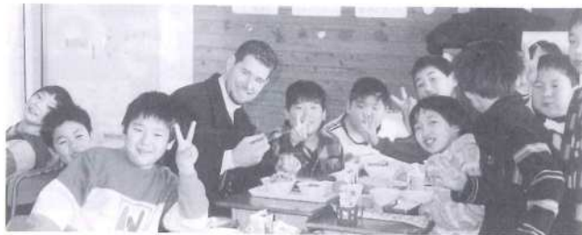
三股西小学校 ランチタイムの国際交流はとてもよかったです。都城市と山田町の国際交流員が来てくれて、それぞれの国を紹介しました。子どもたちはよく聞いて、いい勉強になったと思います。