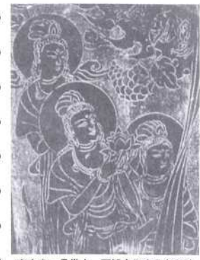
東大寺二月堂十一面観音像光背(部分)

「お水取り」というのは、奈良東大寺の二月堂で、三月一日から十四日まで行われる法会で、天下安穩・五穀成熟・万民豊楽を祈願するものです。正しくは修二会といいますが、これは天平勝宝四(七五二)年から千二百五十年近くの間、続けられてきています。二月堂の修二会にはある開伽井屋の中の若狭井から水をくむことから「お水取り」、夜の行事で松明が振られることから「お松明」の名でも親しまれています。松明は三月一日から十四日まで焚かれ、この火の粉を浴びると、諸病が退