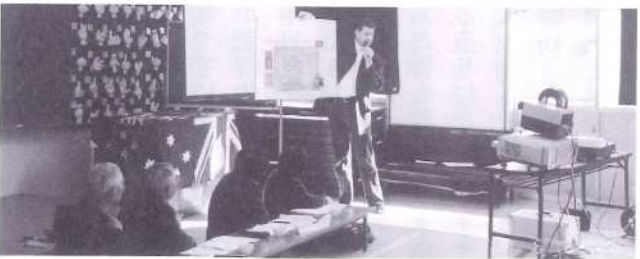
老人クラブでのスピーチはとても楽しかったです。年配の人達と会う機会はありませんから、本当にいい経験になりました。皆さまが私の話を聞いていただき、ありがとうございました。チャンスがありましたら、またオーストラリアの発表をしたいと思っています。