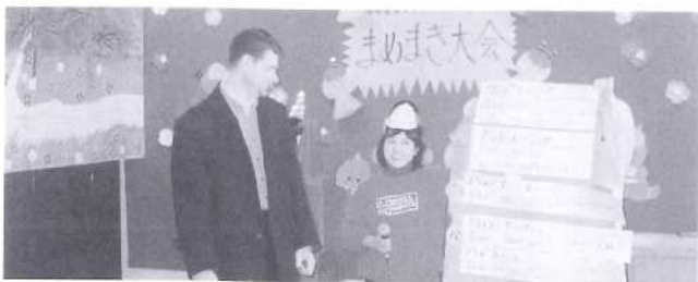
りんどう保育園と三股幼稚園 2月3日に豆まきを体験しました。オーストラリアはこの行事はないのでとてもおもしろかったです。