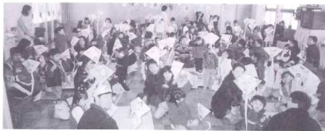
みまた幼稚園で凧を作りました。凧を作るのは初めてだから、たぶん子どもたちより私が喜びました。ありがとう!!!

早めにお申し込みください。チームでも個人でもけっこうです。 役場のジェイミーが松野にお問い合わせください。電話：52-1111 内線361