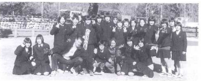
都城泉ヶ丘高校で生徒たちにクリケットを教えました。楽しんでやっていました。女性もとても上手だったので、プロになったらいいんじゃないかなあ???