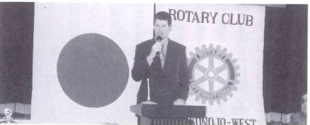
都城西ロータリークラブでのスピーチ いろいろな話をさせていただきまして、ギャグも笑ってくれてありがとうございました。また、今後ロータリークラブのイベントがあったら、ぜひ参加したいと思っています。