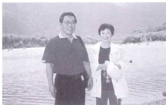
上高地「大正池」にて。隣りが妻です。

元気な町、三股の皆さまへ広報紙を借りてお便りします。私が生まれ育ったのは、町の中心から東岳へ向かう梶山です。矢ヶ測のメガネ橋を拠点に、上流は長田のダムの上から下流は日豊線の鉄橋の付近まで、ある時は中野の川でと、泳ぎに釣りにと行動範囲を広げていたものです。そのせいか、今でも海釣り海水浴は好きになれません。あまりにも清流の思いが強いのでしょうか。たまの帰省の際に一番に足が向くのも矢ヶ測公園になります。今は遊泳はできないようですが、年長者も年少者も一緒になって泳ぎを覚え、先輩後輩の機微を感じ取っていった場所です。今は魚の姿を橋の上から見てとるのが困難になりましたが、たくさん群れを見ることができたのです。この場所から山田橋に至る川沿いの堤防に、桜並木を造ったら素晴らしい景観が演出できるだろうと空想もします。