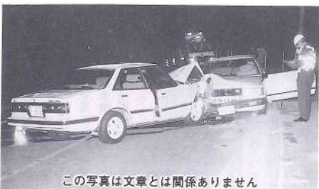
この写真は文章とは関係ありません

夫は自業自得でありましょうから、如何ように責められてもしかたありません。でも、あとに残った私と子ども二人にまでその責任があるでしょうか。私に財産がなくさんあれば、ご遺族の方の気の済むように弁償したいと思えます。いくらお金をあげたからと言って亡くなられた人の命を元通りにすることは出来ませんが、でも私には何もありません。それでも将来、家をたてるために貯金していたお金が九十七万円程あったのでございます。それで私はこのお金とテレビ、冷蔵庫、洗たく機、洋服ダンス、時計、指輪、夫の洋