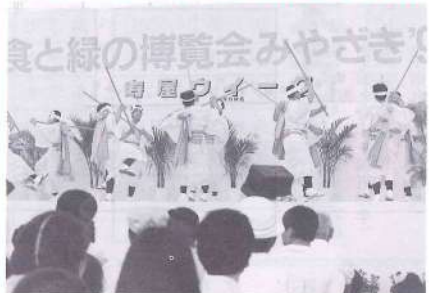
写真は上米の棒踊り