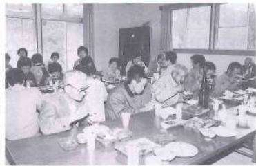
プが昼食を準備し、参加者は楽しいひとときを過ごしました。