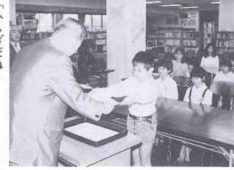
「ふしぎだね おもしろいね 本の世界」