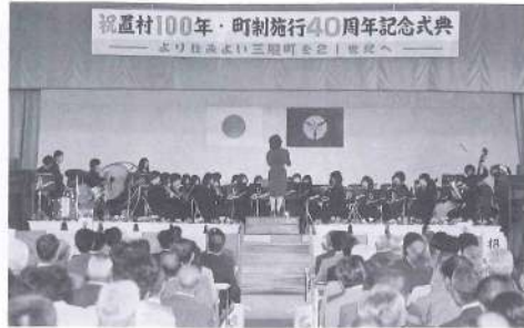
式典に花を添えた 吹奏楽部の演奏