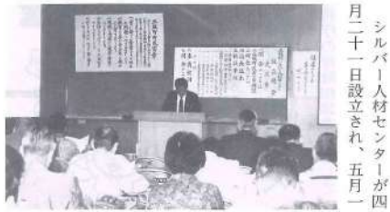
シルバー人材センターが四月二十一日設立され、五月一日から営業を開始しました。

日から営業を開始しました。同センターは、定年などで勤めをやめたり、家を後継者に譲ったりした高齢者がその豊かな経験や能力を社会に生かそうと設立されたものです。現在約百名の会員が賞状書きや庭の手入れ、病人看護、倉庫管理など各分野で活躍しています。 どんな仕事でもお気軽にご相談ください。また、六十歳以上で働く意欲のある方なら、どなたでも入会できます。 お問い合わせは、三股町シルバー人材センター（☎五二一七二五〇）まで。