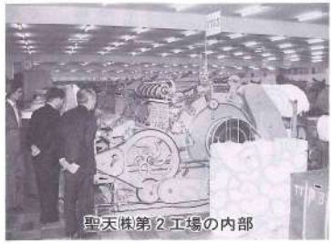
聖天(株)第二工場の内部