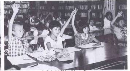
わたしはだれでしょう