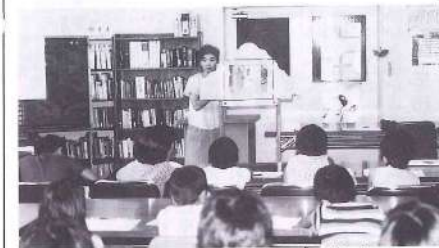
ぶどうの会のお母さんからのプレゼント