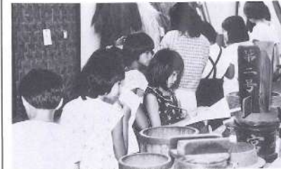
昔から伝わる生活用具を学ぶ

九月三日(土)図書館を利用して町内五つの小学校の子供代表三十四名が参加して読書仲間づくりをしました。 郷土資料室で、先人の使った生活用具を学んだ後、図書の名前あて(わたしはだれでしょう)や強く心を打たれた本、それに、ぶどうの会のお母さんからのプレゼント(「よだかの星」ほか)など楽しんで一日を過ごしました。