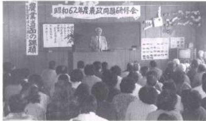
堀之内代議士を講師に 農政問題研究会を開催