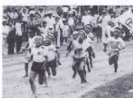
公民館人生リレー(男子)スタート