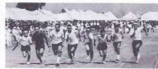
中学1・2・3年生による1,800メートルリレー(スタート)