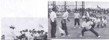
夫婦なかよく(50才以上)