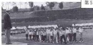
胸をはって堂々の入場行進