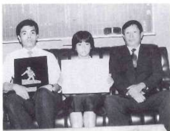
大蔵大臣表彰に輝く梶山子ども郵便局

同子ども郵便局は、昭和四十一年に設立以来今日まで、貯貯金活動はもとより貯蓄思想の普及等の面で努力されてきた。その間、郵政大臣賞をはじめ郵政局長賞、貯金局長賞、大蔵大臣賞と数多くの受賞歴もっています。今回はそれに加えての最高賞受賞ですから、同校の喜びもひとしおだったようです。