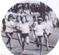
小学4・5・6年生による1,600メートルリレー