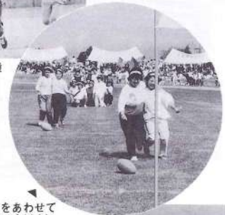
力をあわせて(30才以上)