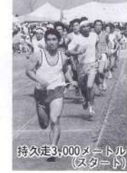
持久走3,000メートル(スタート)