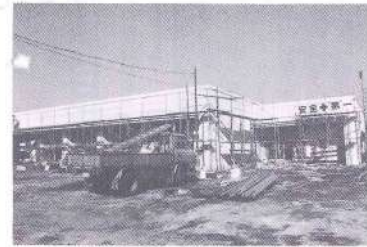
完成が待たれる第8地区公民館

と、立地条件の中で区画整理事業が功を奏し、人口漸増の傾向にあることは、本町の発展につながるものも存じます。