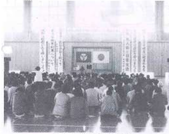
盛大に行われた大会

このような問題解決のため、町及び町健康づくり推進協議会では規則正しい生活「栄養・運動・休養」で、より一層健康になり、明