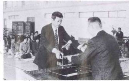
表彰を受ける町和牛青年研究グループ