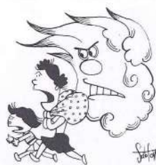
秋の全国火災予防運動 11月26日-12月2日