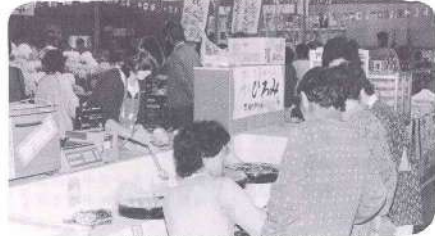
体育センターでの展示即売会