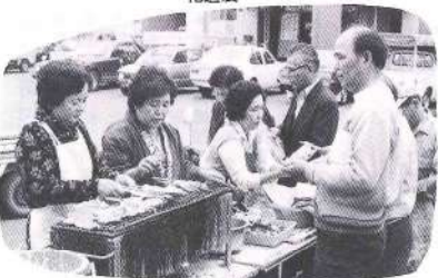
商工会婦人部のバザー