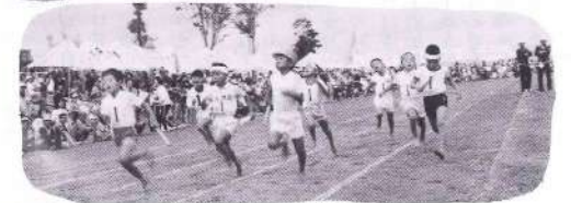
公民館人生リレー(男)の出発