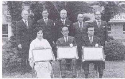
受賞者を前に記念撮影

氏は、昭和五十一年榊山スポーツ少年団を結成以来、スポーツを通じて、青少年の健全育成に尽力されております。特に氏の率いる少年団は規律や礼儀が正しく、また、町内の公共施設等の清掃なども定期的に行い、団員ばかりでなく、その父兄にまで、奉仕的活動の気運を高めています。