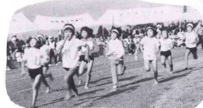
公民館人生リレー(女)の出発