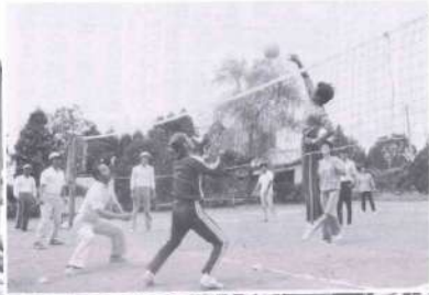
大きざすのパレーボール大会