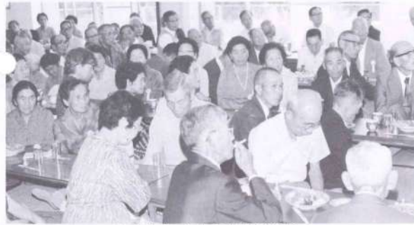
有意義だった第4地区の敬老会