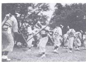
宮崎国体に出場する上米棒踊り