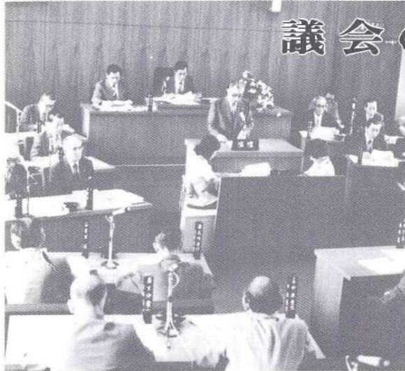
6月定例議会で提案理由説明を行う町長