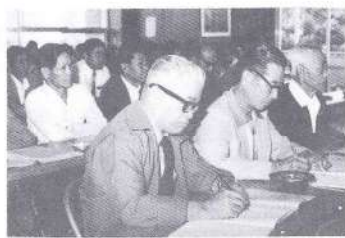
講演に関与する各団体の幹部