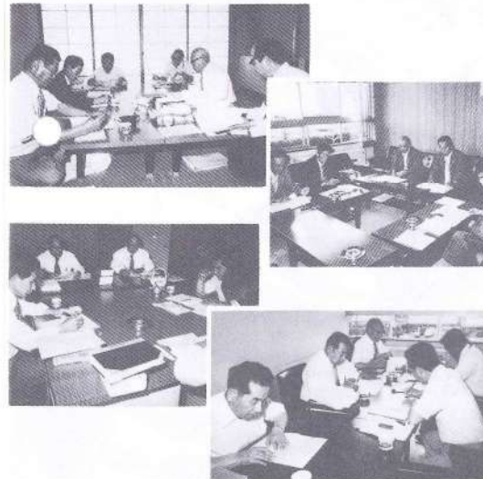
各常任委員会の議案審査状況