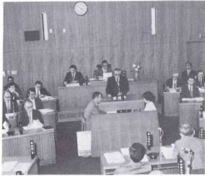
▲9月定例会において所信を表明する