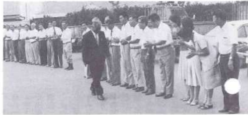
▲職員に迎えられて元気に登庁