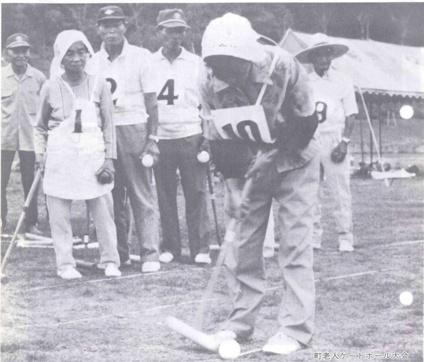
町老人ゲートボール大会