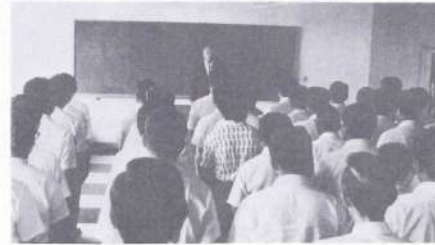
▲職員に決意のほどを述べる