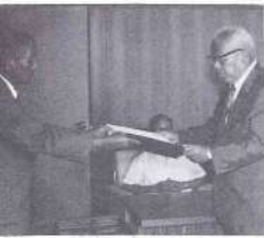
▲当選証書を手にする茨木議員