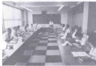
▲町制施行30周年記念事業打合せ会