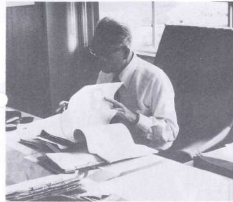
▲書類に目をとす 決裁書類に丹念に目をとす