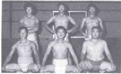
▲全国大会に出場する青年すもう部

九月十六日、十七日県総合運動公園を主会場として行われた、第二十七回県青年体育大会すもうの部で、本町の青年連協すもう部が優勝し、来る十一月九日から東京国立競技場で行われる全国青年大会に出場します。