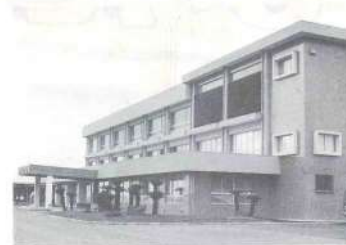
現在の庁舎(昭和46年完成)

三股町が町制を施行したのは昭和二十三年五月三日で、今年で丁度三十周年を迎えました。三股には発掘される土器などから新石器時代より各所に人が住んでいたことが伺われます。また、その名の起源は「古は三条にて流れたり」と古書にあってその名「三股」をとどめたと言われています。徳川時代は薩摩藩に属して三股郷と称し、明治初年には五戸長(福山・長田・餅原・豊池・宮村)があり明治五年には里止がおかれ戸