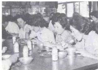
有意義だった試食会

創立百周年を昭和四十八年に迎えた伝統ある梶山小学校が今回改築されます。梶山小学校は明治六年創立されて以来幾多の厳しい試練を経て地域の伝統を受け継ぎ教育文化の向上に動んで来ました。その効果はあらゆる面に現れております。梶山地区は古くから教育については特に熱心で三股町の教育は梶山地区が支えて来たと言える程現在でも尚数多くの教育者が活躍されております。現在職員八名児童百十五名で先生も児童も一緒になって勉学に励んでいる学校で過去健康優良校、林優秀校等全国一の栄誉を何回も獲得し、またPTAも昭和四十六年優良団体として文部大臣表彰を受賞している学校で県内は勿論、全国でも有数の優良学校として知られております。今年度この梶山小学校の校舎の老朽化に伴い現在地に新しく鉄筋コンクリート二階建てのモダンな校舎が新築される予定でありまして。昭和二十四年から二十九年にかけて建設された町内では唯一の木