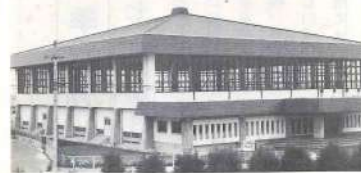
武道体育館(昭和52年度建設)