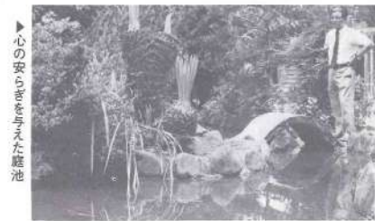
▶心の安らぎを与えた庭池