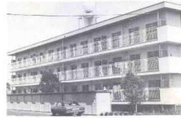
稗田住宅(昭和52年度建設)

三股町が町制を施行したのは昭和二十三年五月三日で、今年で丁度三十周年を迎えました。三股には発掘される土器などから新石器時代より各所に人が住んでいたことが伺われます。また、その名の起源は「古は三条にて流れたり」と古書にあってその名「三股」をとどめたと言われています。徳川時代は薩摩藩に属して三股郷と称し、明治初年には五戸長(福山・長田・餅原・豊池・宮村)があり明治五年には里止がおかれ戸