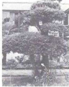
▶百年の風格を物語るつげ

創立百周年を昭和四十八年に迎えた伝統ある梶山小学校が今回改築されます。梶山小学校は明治六年創立されて以来幾多の厳しい試練を経て地域の伝統を受け継ぎ教育文化の向上に動んで来ました。その効果はあらゆる面に現れております。梶山地区は古くから教育については特に熱心で三股町の教育は梶山地区が支えて来たと言える程現在でも尚数多くの教育者が活躍されております。現在職員八名児童百十五名で先生も児童も一緒になって勉学に励んでいる学校で過去健康優良校、林優秀校等全国一の栄誉を何回も獲得し、またPTAも昭和四十六年優良団体として文部大臣表彰を受賞している学校で県内は勿論、全国でも有数の優良学校として知られております。今年度この梶山小学校の校舎の老朽化に伴い現在地に新しく鉄筋コンクリート二階建てのモダンな校舎が新築される予定でありまして。昭和二十四年から二十九年にかけて建設された町内では唯一の木