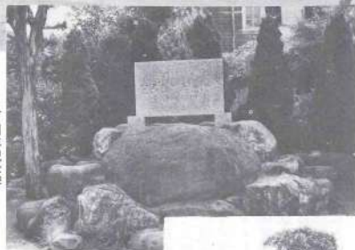
▶百年の風格を物語るつげ