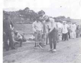
ゲートボールを楽しむ老人クラブ

先に行われた県民体育大会、高校総体では多くの新記録が生まれ日本のふるさと宮崎国体への大きな夢と期待を一段と高めました。本町においても体育施設を年々整備し、昨年度完成した武道体育館、勤労者体育センターに引続き今年度は旭ヶ丘運動公園の一角にソフトボール場二面、ゲートボール場三面を建設中であり九月末には町民のスポーツ広場としてオープンする予定であります。一方スポーツ人口も昭和五十年に比べて二倍強と急増し現在二千五百九十二名(53・4・1現在保健体育課調べ)で成人四人一人はスポーツ団体に加入することになります。