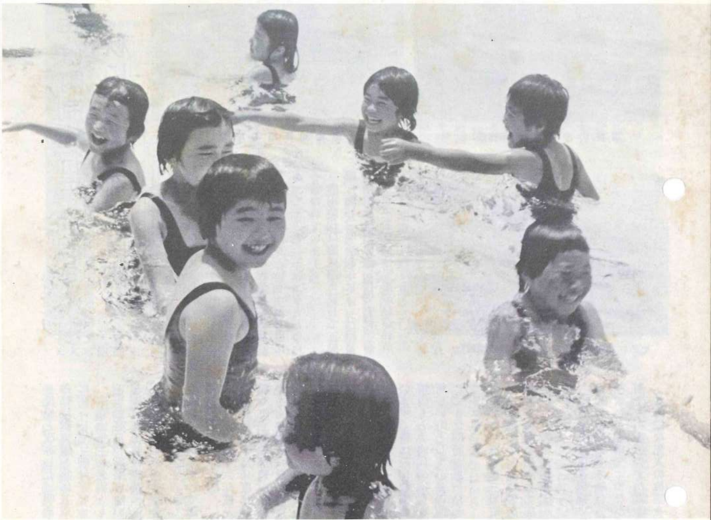
写真は宮村小のプール開き