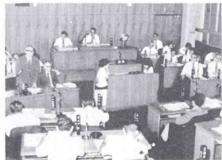
町議会総括質問風景

6月議会開催される 今回の提出議案は、国民健康保険税条例の一部を改正する条例など条例改正議案が六件、昭和五十三年度三股町一般会計補正予算(第三号)など補正予算案が四件で十議案が上程されました。六月二十日提案理由説明、二十一日は休会(議案熟読)二十二日総括質問が行われ二十三日から各委員会ごとに議案審議がなされ