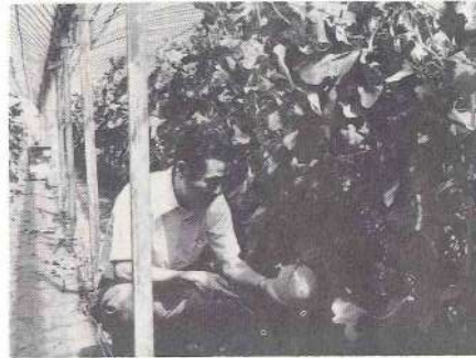
町ではじめて栽培したハウスメロン

最近ではメロンの種類が多くなって店頭でも色々な種類のもが見られるようになりました。メロンは高級果物として大衆の口に入る機会が少なかったのですが、プリンスメロンが現われてから急速に大衆化されました。しかしマスクメロン(温室メロン)は今だに価格も高く、めったに口に入りません。ところで、真珠メロンは最近出されたハウス栽培用のメロンで外観が温室メロンに近いし、味も温室メロンと変らない大衆マスクメロンと言えましょう。ハウスメロンとしては数多くの品種があり、それぞれ特徴をもっていますが、