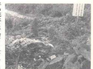
空地にバラまかれたゴミ

した信号機をつかって五台の自転車の乗り方に乗って、正しい自転車の乗り方の練習、続いて正門前の道路で正しい自転車の乗り方の実地指導を受けた。こうした、徹底した交通安全を学んだ幼児や児童はこれからは絶対「道路に飛び出さない。道路で遊ばない。正しい自転車で乗ります。」と誓い、これから交通事故防止教育の成果が期待されます。