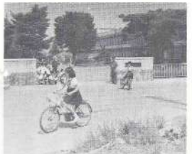
正しい自転車の乗り方を学ぶ児童たち

一方、三股小も十三、十四日の両日、三、四年生をそれぞれ学級別に一校時間づつ、運動場に設置