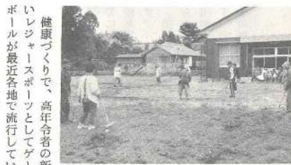
ゲートボールを楽しむ年寄りたち

健康づくりで、高齢者の新しいレジャースポーツとしてゲートボールが最近各地で流行しています。