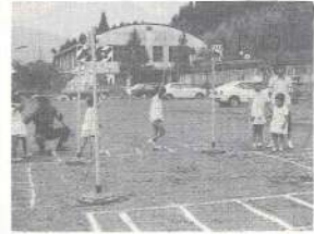
正しい横断の渡り方を学ぶ園児たち

々右を見て、左を見て、もう一度右を見て、ハイ横断ク交通安全協会三股支部は交通弱者といわれている幼児、児童を対象にした交通安全教室が開かれていた。