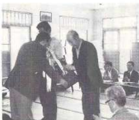
トロフィーを受ける第5地区

十八件で、本町の事故違反件数は年々増えている現状であります。私たち一人一人がいま一度、交通安全について真剣に考えたいものです。