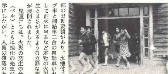
真剣な表情で避難する児童

完成したひえ田住宅団地の周辺は、区画整理事業が整然とした区画割りとなされており、住宅地として交通の便はよく、通勤、通学の交通安全面でも最適で安心の地といえます。 こうした好条件にめぐまれて、一般住宅も早いテンポで建ちならんでいます。本年度も引き続き町民の要請にこたえて、町営住宅をひえ田に建設する予定であり、更にわたしたちの町の発展へと前進していくこととしよう。