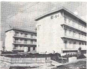
完成した町営住宅(3 建)

町営住宅も、いよいよ中高層建設(三階建)に変わりました。町営住宅といえは、これまで一戸建てや長屋式の平屋建てで、現在七百九十六戸の住宅が建設されています。町民の皆さんは勿論、町外の方も町営住宅といえは三股町といわれるほど、都城市に隣接し地理的にも最もめづれた住宅のベッドタウンとして、現在でもなお町営住宅の入居希望者が多く、後を絶ちません。