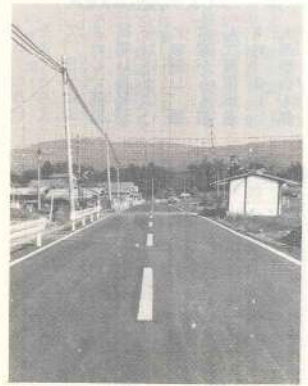
餅原部落内舗装完成

ました。しかし、最近の車の増加と大型化によって、路面は日を追って悪化し、道巾も狭く、拡巾の時期となり沿線の方々