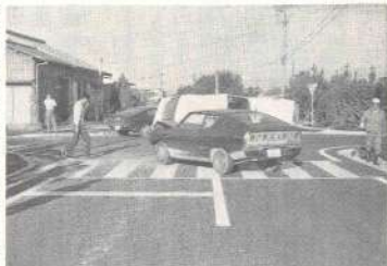
環境が重要であるかと物語っている。計画性もなく、家出したもの行先もないまま、ぶらついている家出少年達の道は、警察に発見されて保護された場合は、別として「ドロボウするか、暴行団等の犠牲となるか」いずれにしても、転落への道が待っている。

三ツの事故をおこした原因は「トマレ」の標識無視と前方不注意による事故であります。こうした、依然減らない交通事故防止のために、町内の各所で取り締まりが強化されています。 一方県警本部も十月十二日から県内では初めての「交通安全月」を来年一月二十日まで展開することになっています。死亡事故原因の五六%を占める速度違反、わき見運転の事故防止