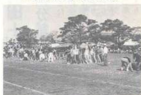
久しぶりの競技に大歓声

や体力の現状をよくとらえて、自分にふさわしい運動に親しみながら力いっぱい、観客席からも盛んな声援が送られ、楽しい大運動会も無事終了しました。 成績は次のとおり 優勝 第四地区公民館 二位 五 三位 六 四位 二 五位 三 六位 一 七位 七