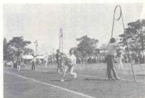
声援をうけて頑張る選手たち

秋はスポーツのシーズン、秋空の下で、体を鍛えよう。 町民体育大会は「体育の日」十月十日三股中学校グラウンドに一万六千町民が参加し、秋空の下で大運動会が盛大に展開されました。 この大会は融和と親睦の成果と明日への活動の糧となり引いては、これが原動力となってわが三股町の発展を推進する目的で開かれており、毎年、この体育の日にはパレール大会と運動会を交互に町民総参加の大会を開いています。